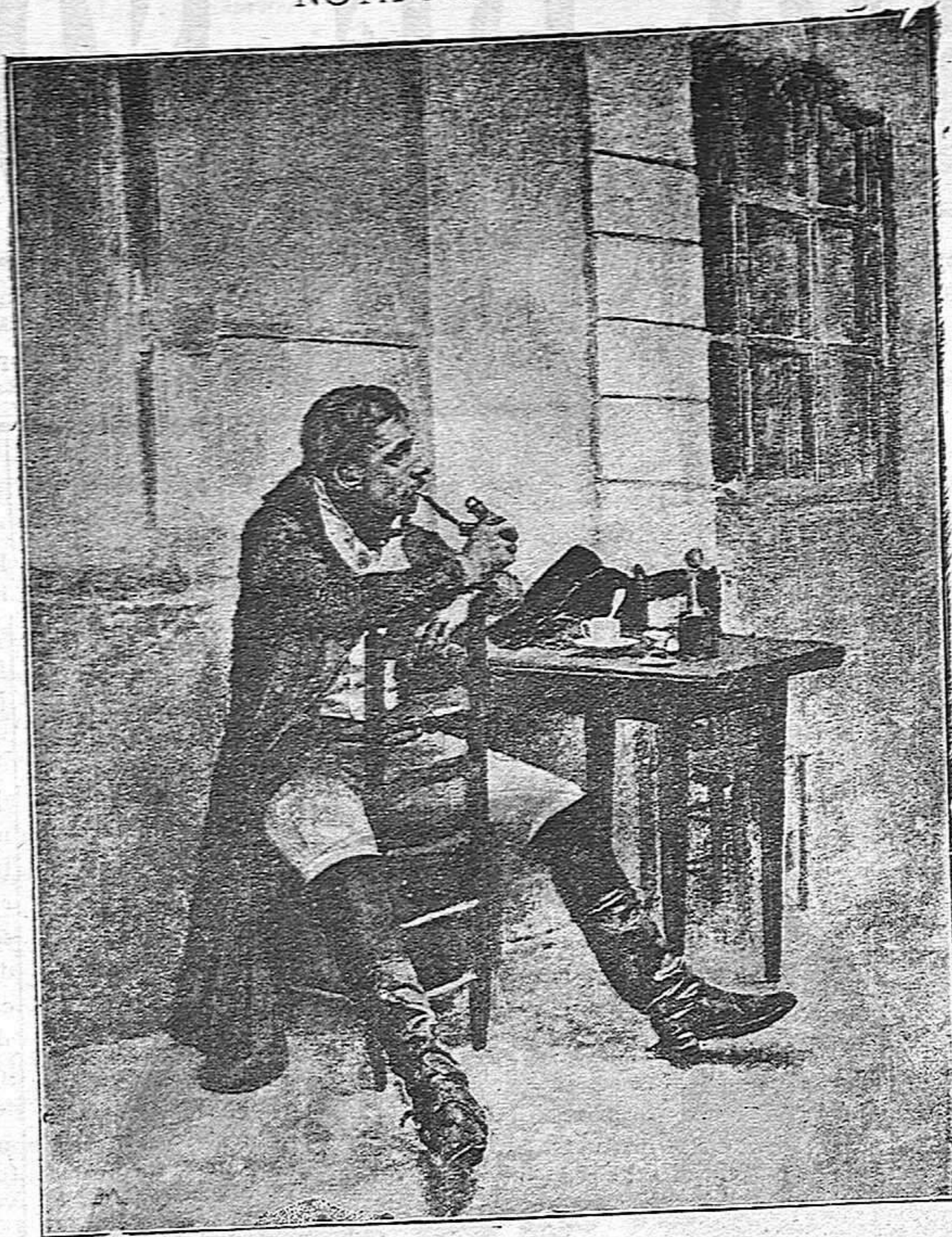
EL CAFÉ. Cuadro de E. Lloret.

ce, lo cual constituye, salvo error ú omisión, un total de ciento cincuenta céntimos. Y advierto á ustedes que poco ha faltado para que el muy tunante no los pagara á tiempo. No siempre, sin embargo, se encuentran gangas como la presente, porque miren ustedes que tener por franco y medio un cubierto que vale dos luises, es cosa aún mucho más rara que la rara avis de que habla Juvenal.