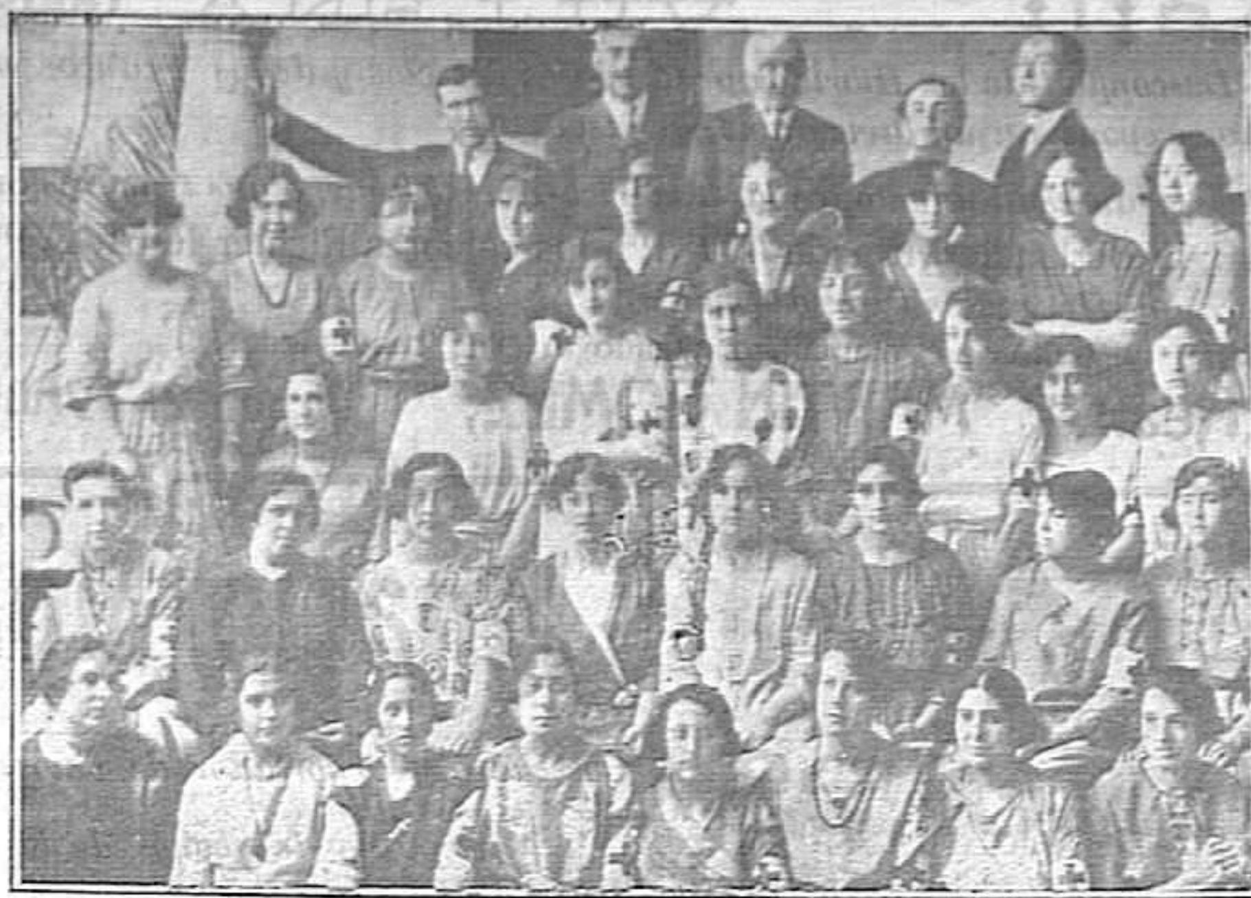
Distinguidas y bellas muchachas de la buena sociedad de Santa Cruz de Mudela que han organizado una brillante tómbola con fines patrióticos.