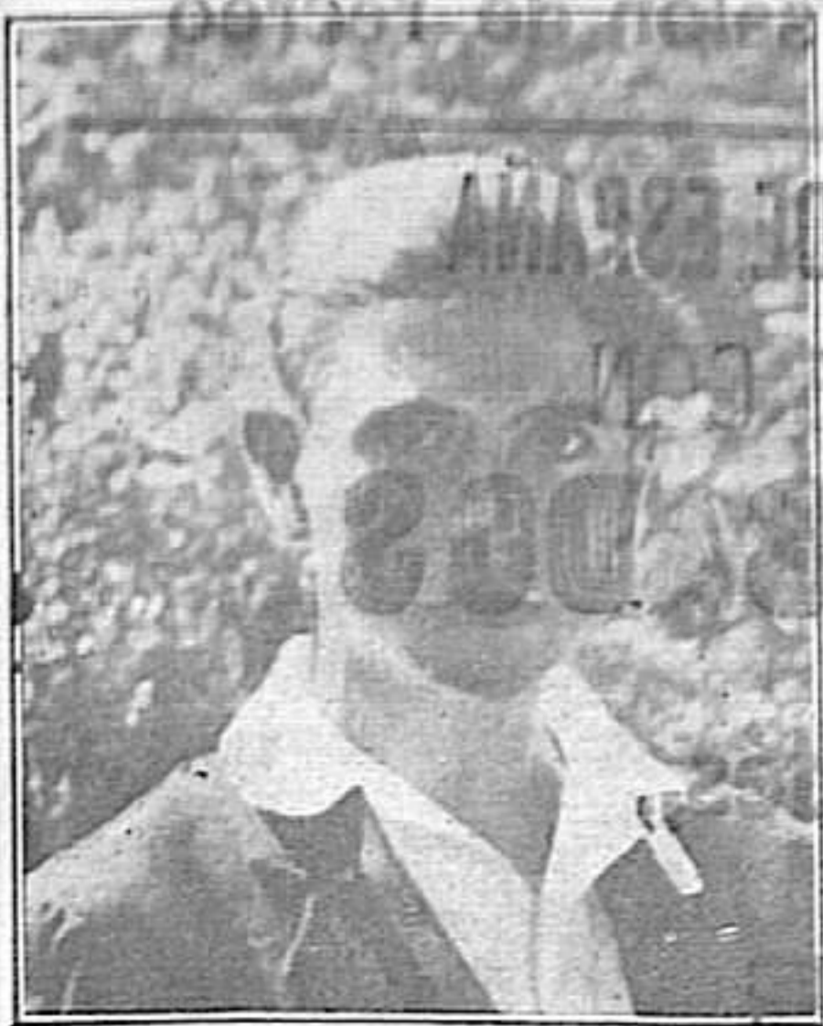
a GREGORIO PRIETO