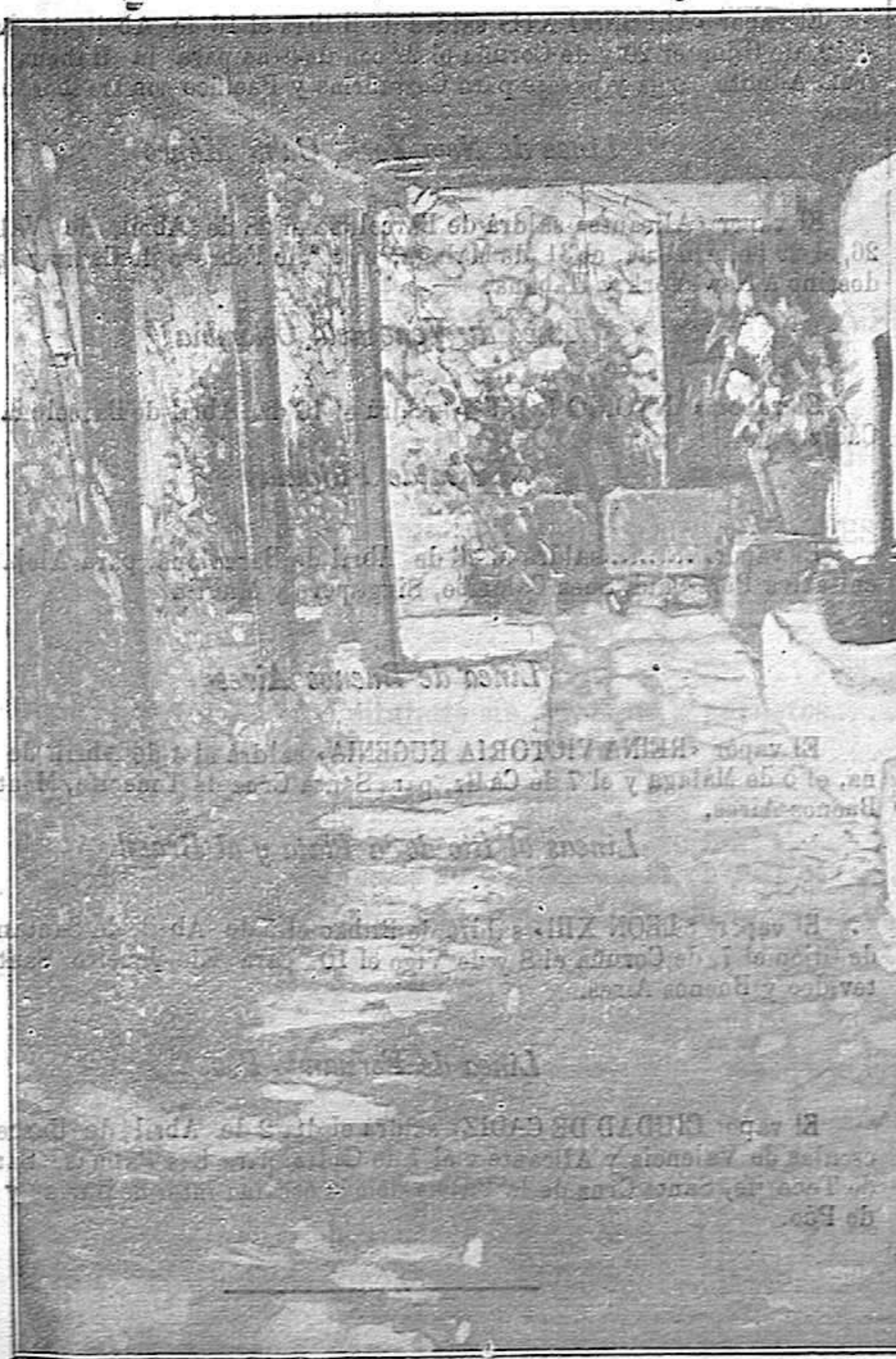
«PATIO BLANCO» (Cuadro de G. Prieto)

EL PUEBLO MANCHEGO abonará cinco pesetas por cada fotografía de actualidad que se nos remita y merezca los honores de la publicidad