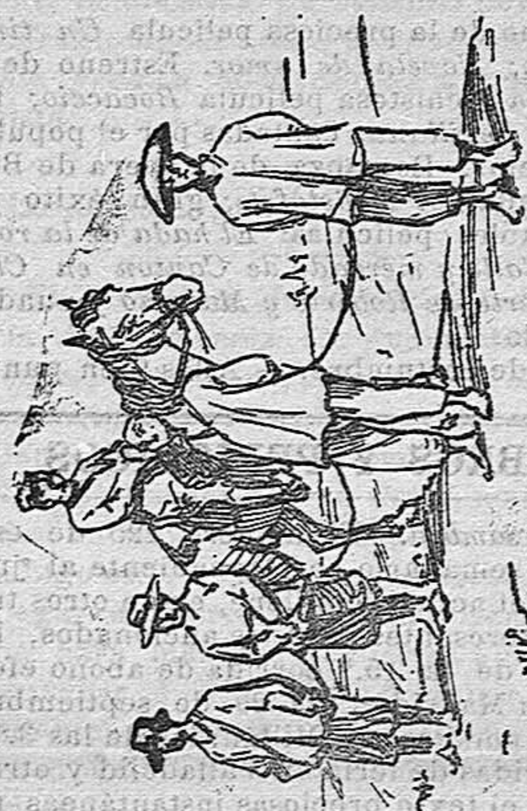
Espías chinos aprehendidos por los japoneses.