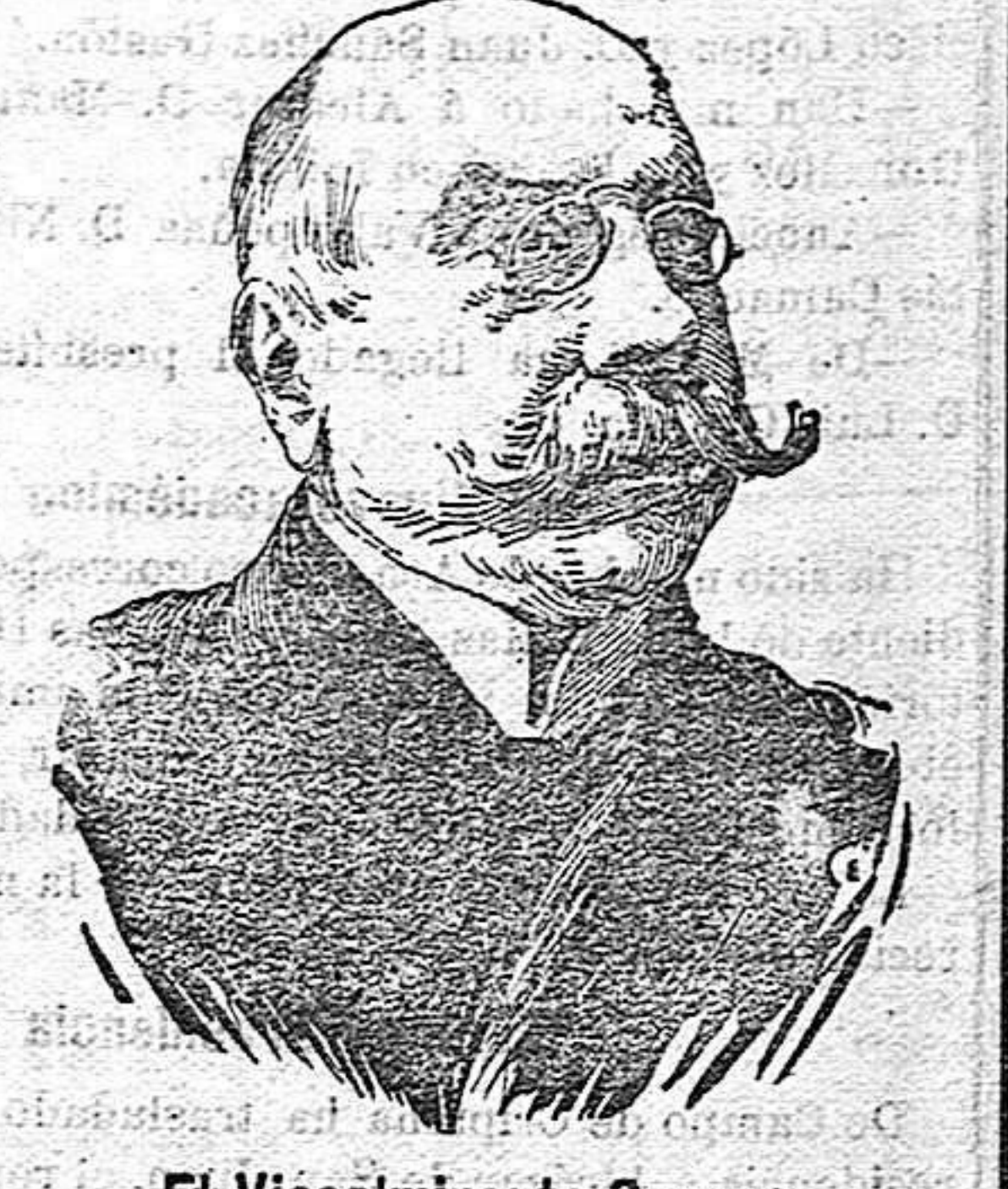
El Vicealmirante Concas

Comandante del crucero «Infanta María Teresa», tomó parte en el combate naval de Santiago de Cuba, del que resultó gravemente herido y prisionero.