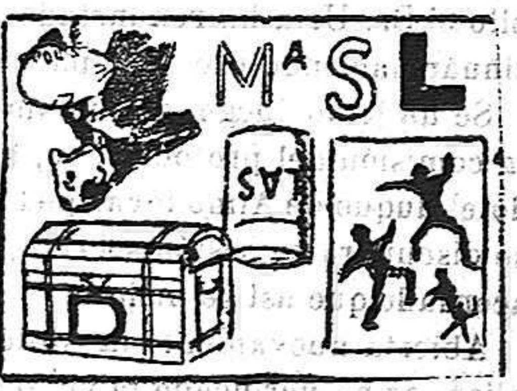
La solución, mañana.