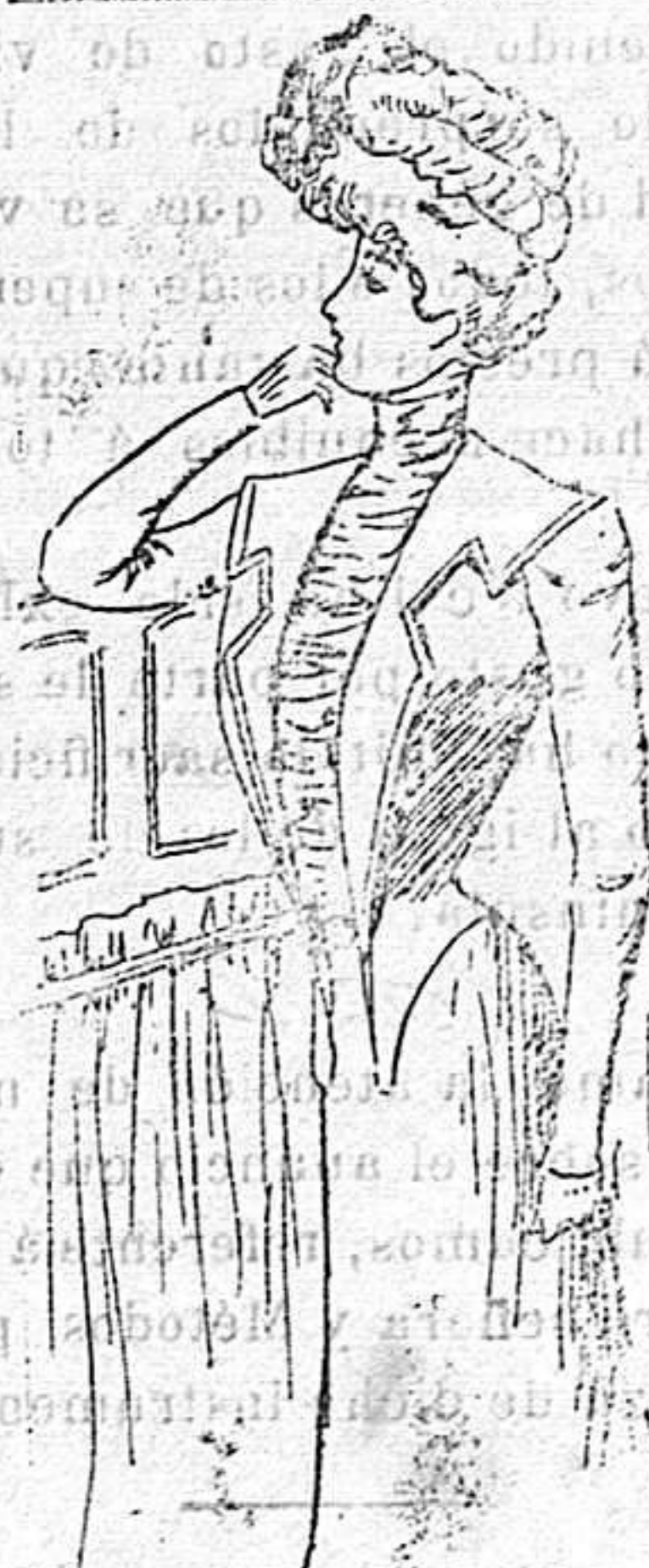
Traje para señorita

ambos lados del delantero por medio de dos tapas con botones.