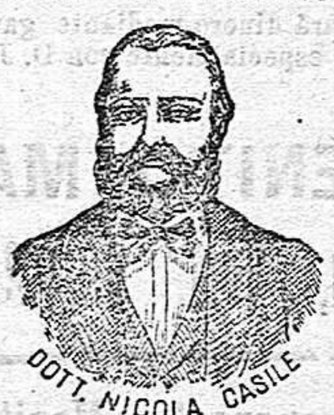
Dr. Casile. Inventor de los renombrados medicamentos CASILE.

han logrado que el Dr. Casile de Nápoles descubriera los milagrosos medicamentos que curan infaliblemente la tisis en cualquiera de sus períodos y todas las enfermedades del estómago. A la más pequeña manifestación de un resfriado, tos, catarro, bronquitis, gripe, asma (sufocación), espectoración y de cualquier enfermedad del pecho, tomar inmediatamente las PERLAS CASILE, que no sólo curan infaliblemente estas enfermedades, sino que se tendrá la completa seguridad de no contraer otras muchas graves. Significando este método se podrá decir no más tisis.