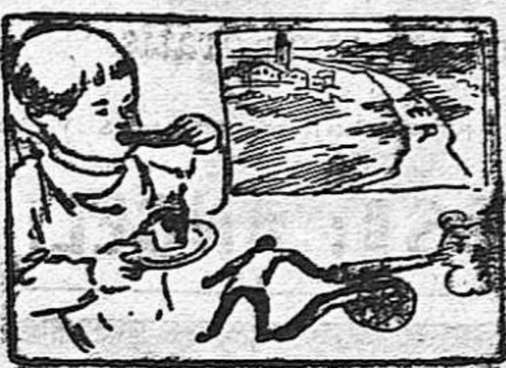
(La solución en el número próximo).

Solución a la Charada en acción Galápagos.