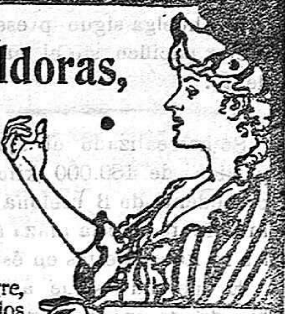
Acerque el grabado á los ojos y verá Vd. la píldora entrar en la boca.

DE VENTA EN LAS BOTICAS DEL MUNDO ENTERO.