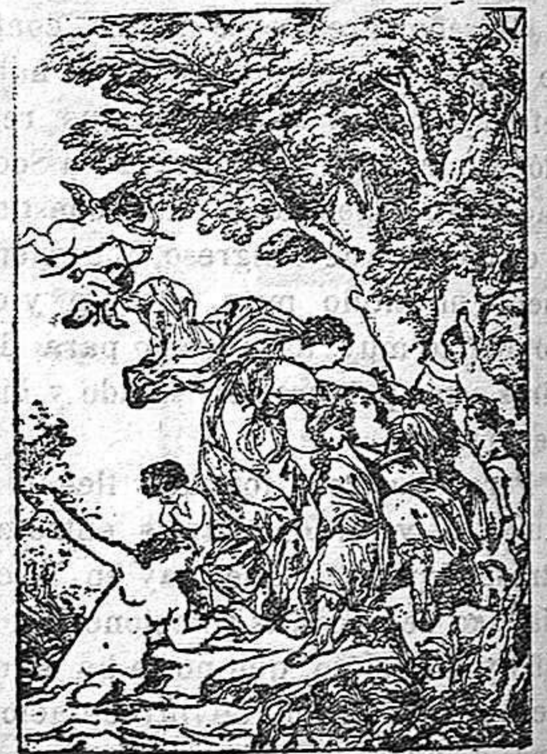
Reinaldo y Armida

El asunto de este cuadro fue tomado del poema de Tasso «La Jerusalén libertada», cuya acción pasa en los últimos años del siglo XI y es el siguiente: