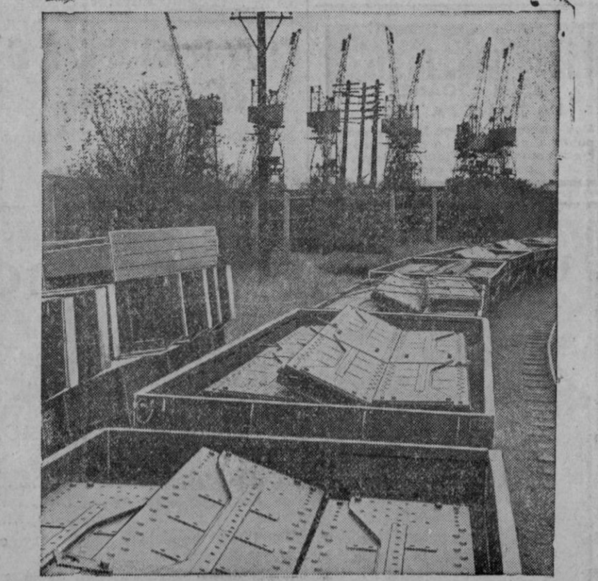
Los primeros abastecimientos que la U. N. R. R. A. envía a China para restablecer las comunicaciones internas de aquel país, se están embarcando en el puerto inglés de Tilbury, en la desembocadura del río Támesis. Trátase de piezas prefabricadas para la construcción de novecientos puentes