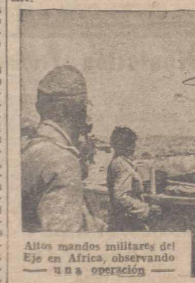
Altos mandos militares del Eje en África, observando una operación