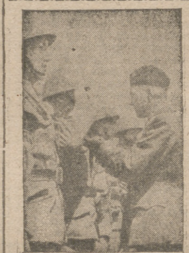
El ministro de Defensa eslovaco, Catle, condecorando a soldados eslovacos que se distinguieron especialmente en la batalla de Rostov

En 1935 desfilaron en Nuremberg los cien primeros aviones militares del Reich y poco después las fuerzas aéreas eran algo más que una esperanza.