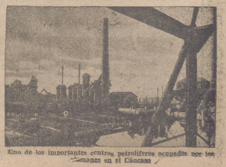
Uno de los importantes centros petrolíferos ocupados por los alemanes en el Cáucaso