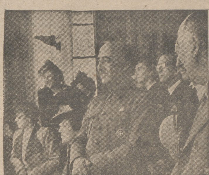
El Caudillo asiste a las regatas en La Coruña

Tokio, 28.—"Todos los convoyes norteamericanos que intenten alcanzar la URSS por el Estrecho de Bering se expondrán necesariamente a los ataques nipones", ha declarado hoy el portavoz del Gobierno japonés, reanunciando a la prensa de su patria.