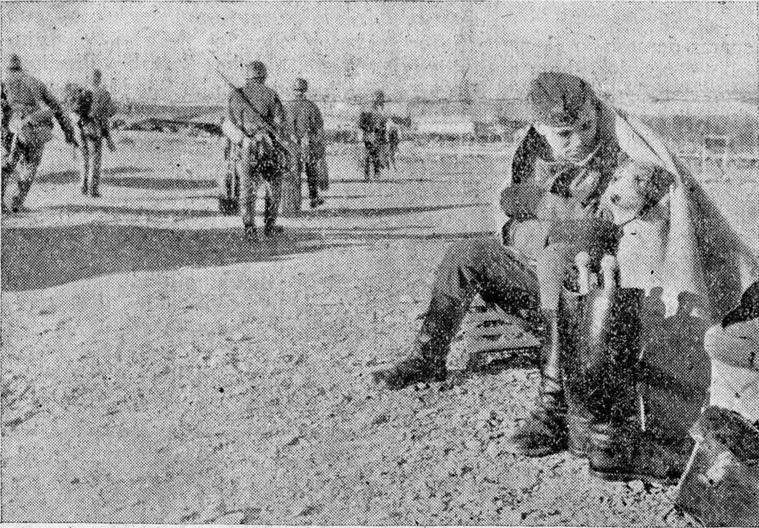
Las fuerzas alemanas, en un momento de descanso, en el aeródromo noruego, que horas antes había sido ocupado por los germanos