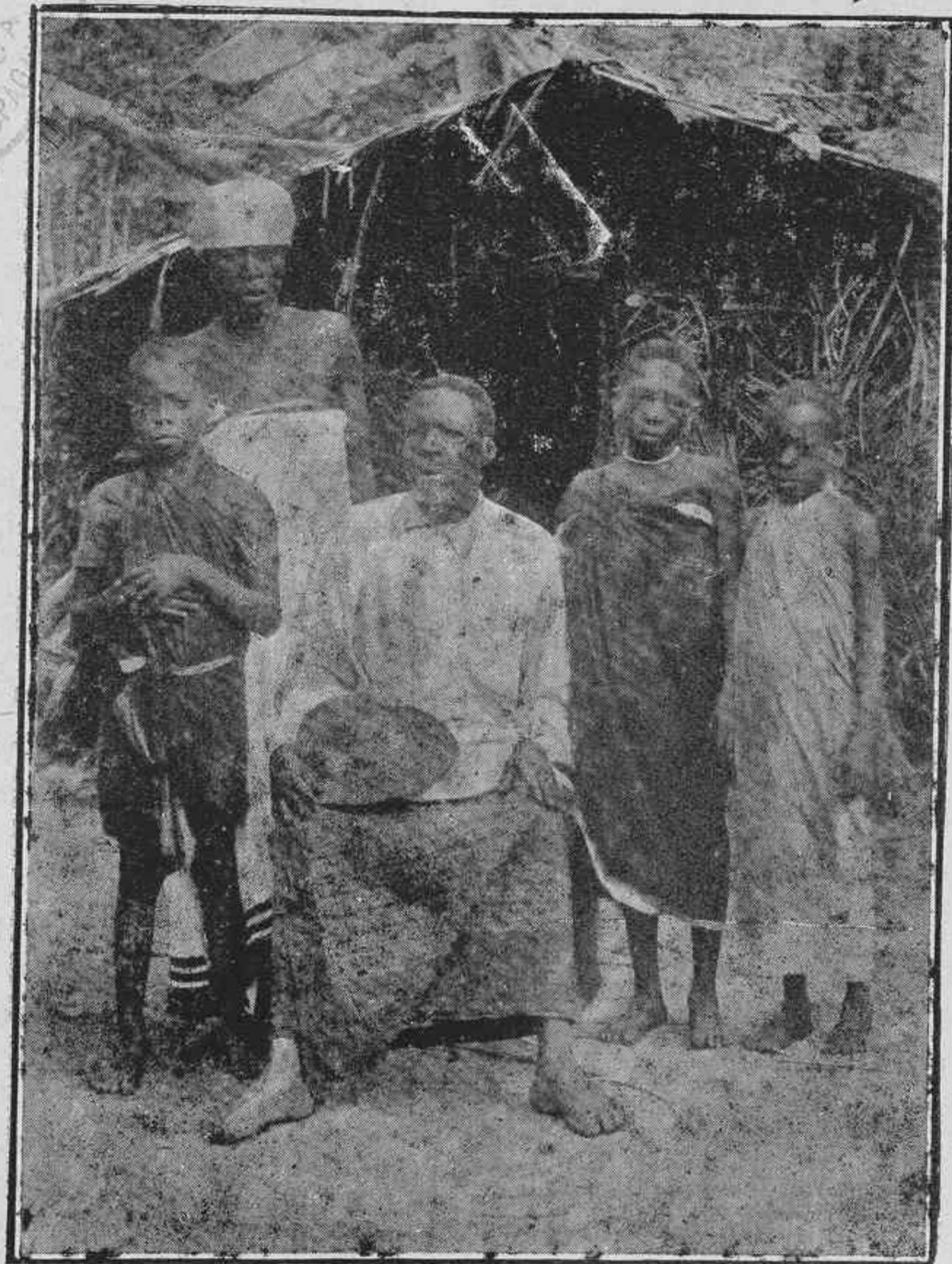
Nuestro grabado Una Familia Bapuku.

SUMARIC. —Portada --Una Familia Bapuku --Alicante-- Portugal -- Gobierno de la Colonia --Noticias de la Colonia; de Rebola --Radios de Prensa.