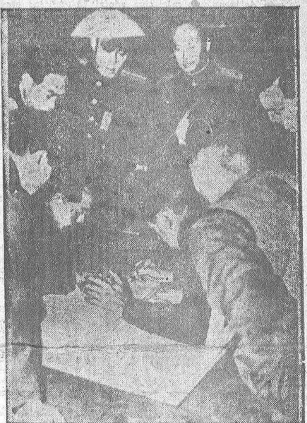
Los oficiales de enlace de las Naciones Unidas y comunistas, en una de sus infinitas reuniones establecen, por fin, la línea de demarcación para un alto el fuego

Los aviones del nuevo Regimiento sustituirán a los F-80, ya antiguos y lentos, que han demostrado no poder