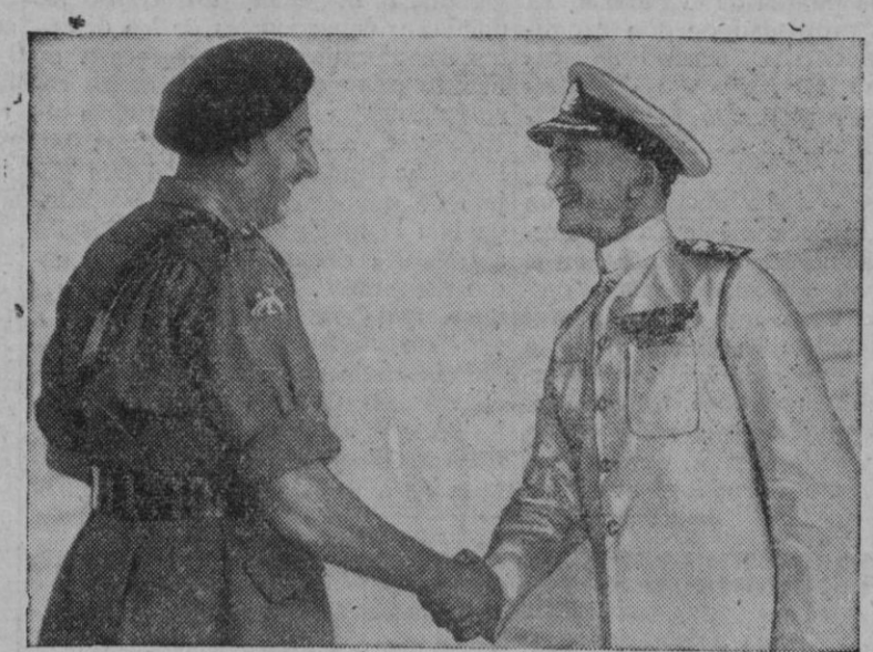
El general Festing saluda al nuevo comandante en jefe de la Flota británica del Pacífico, vicealmirante sir Denis W. Boyd, a la llegada de éste a Hong-Kong, después de desembarcar del portaaviones "Venerable" en donde realizó el viaje