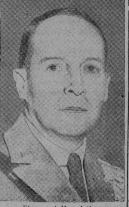
El general Mac Arthur

Tokio, 1 (4 t.).—Agentes secretos norteamericanos se han mezclado entre varios miles de obreros reunidos al anochecer en las inmediaciones del Palacio Imperial, para tratar de localizar a los promotores del complot para dar muerte al jefe supremo aliado general Mac Arthur.