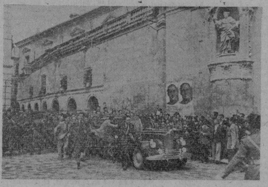
El Caudillo, a la entrada de Murcia, fué acogido con indescribible júbilo por la multitud cuando se dirigía a la plaza del Cardenal Belluga. En el trayecto, la muchedumbre, llevada de su entusiasmo, difundió el paso del vehículo del Generalísimo

Paso del Caudillo por los pueblos en su viaje a Albacete Murcia, 30.—Después de la apacible despedida que Cartagena hizo esta tarde al jefe del Estado y al Generalísimo, el entusiasmo hizo desbordarse el entusiasmo en la ciudad, el Generalísimo prosiguió su viaje hacia Madrid. A su paso por los pueblos de este término se reiteraron las muestras de entusiasmo. En el pueblo del Pamar se unieron a la comitiva el alcalde y el presidente de la Diputación, ya que el gobernador acompañaba al Caudillo desde Cartagena. Todo el vecindario le esperaba en las afueras del pueblo ovandole insistentemente, aparejado todo el pueblo engalanado con banderas y guirnaldas y el suelo cubierto de flores. Desde este pueblo el Caudillo se dirigió a Albacete.