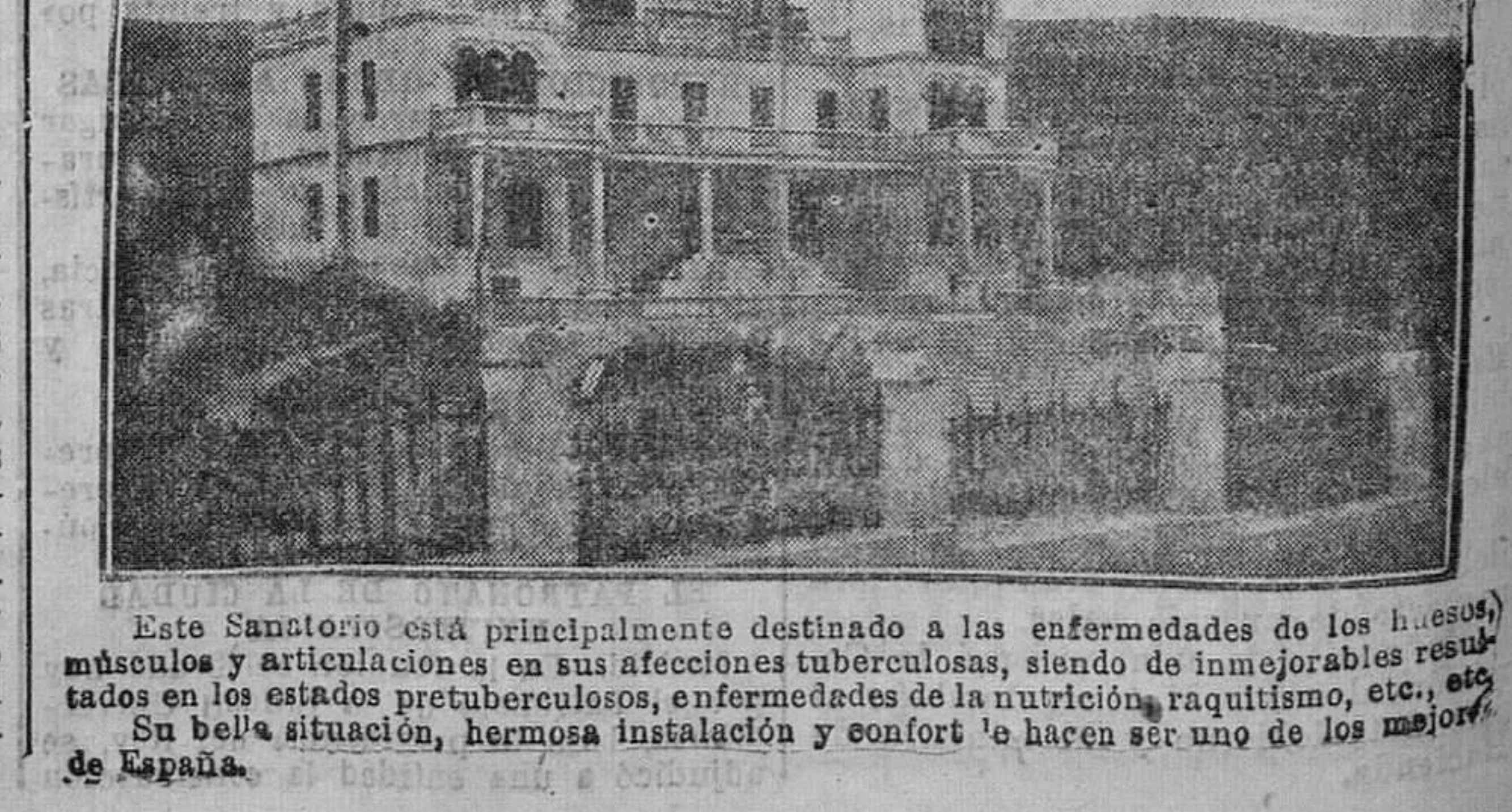
Este Sanatorio está principalmente destinado a las enfermedades de los huesos, músculos y articulaciones en sus afecciones tuberculosas, siendo de inmejorables resultados en los estados pretuberculosos, enfermedades de la nutrición, raquitismo, etc., etc. Su bella situación, hermosa instalación y confort hacen ser uno de los mejores de España.