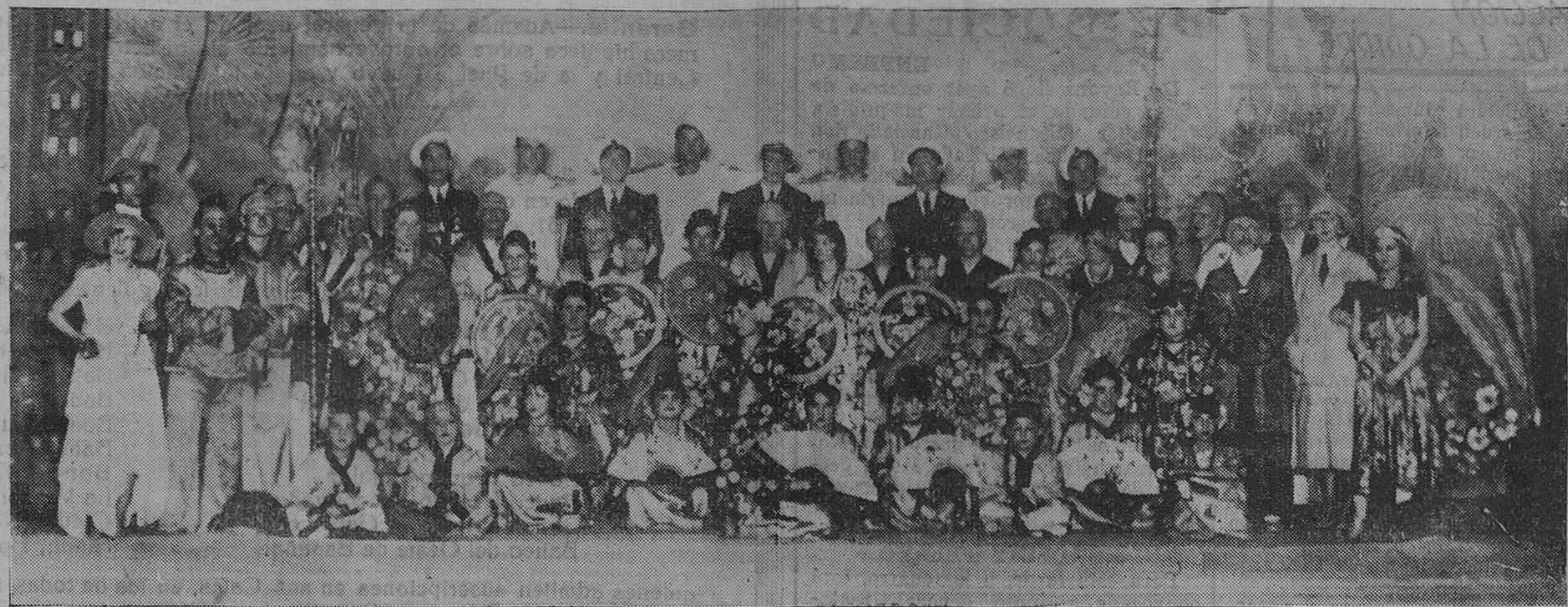
"LOS AMIGOS DEL ARTE".— Escena final del acto segundo de la opereta japonesa "La Geisha", representada brillantemente por esta agrupación en el Teatro Pereda.