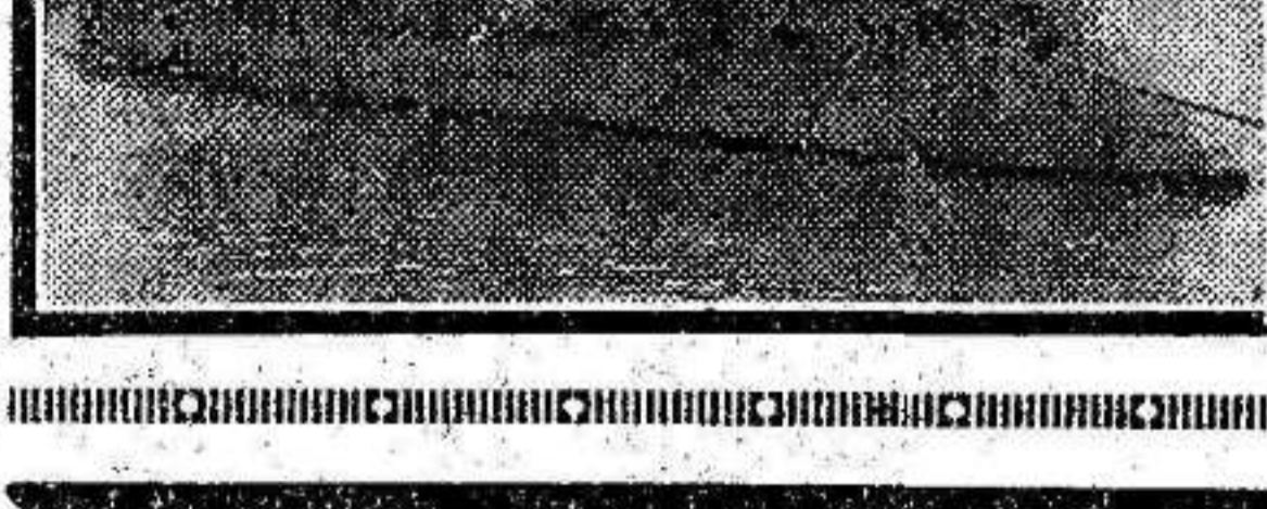
El crucero "Libertad" y la dotación del mismo, que tan heroicamente se ha comportado en la lucha común por la República y la libertad.