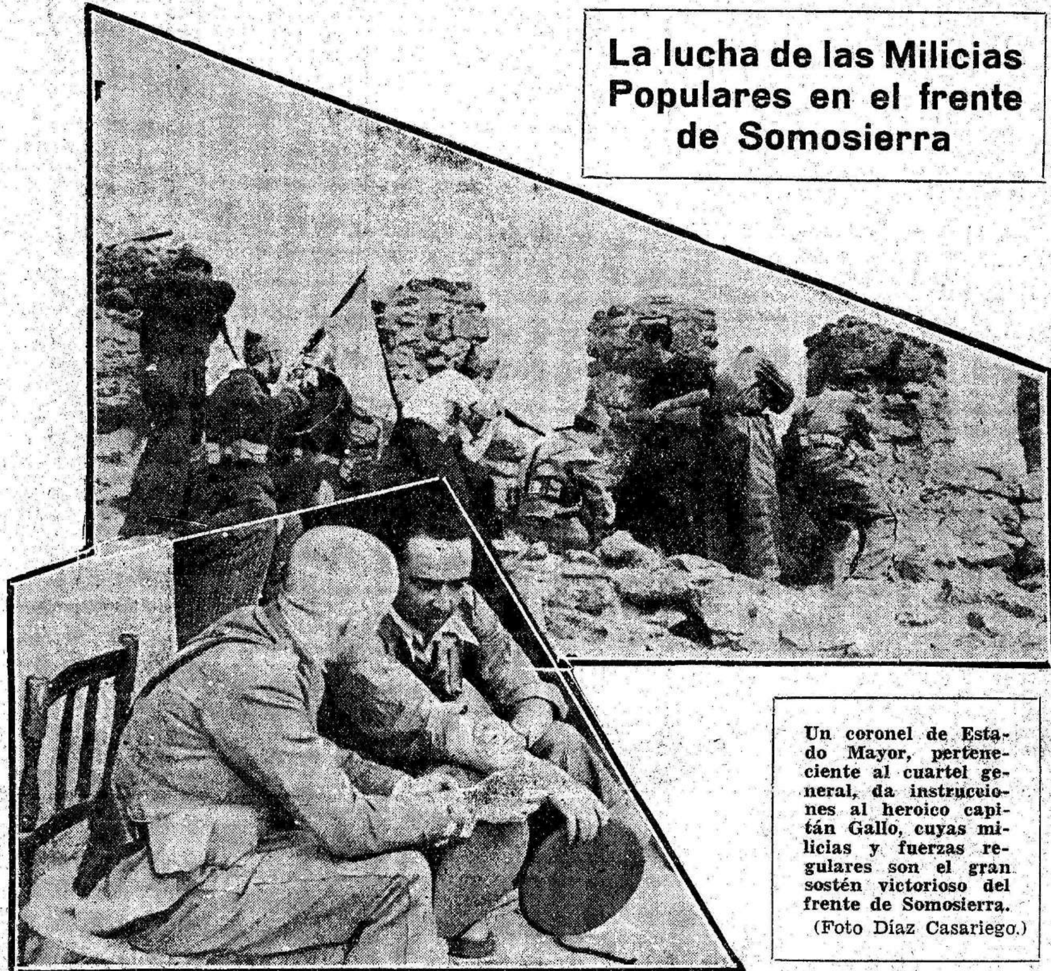
La lucha de las Milicias Populares en el frente de Somosierra