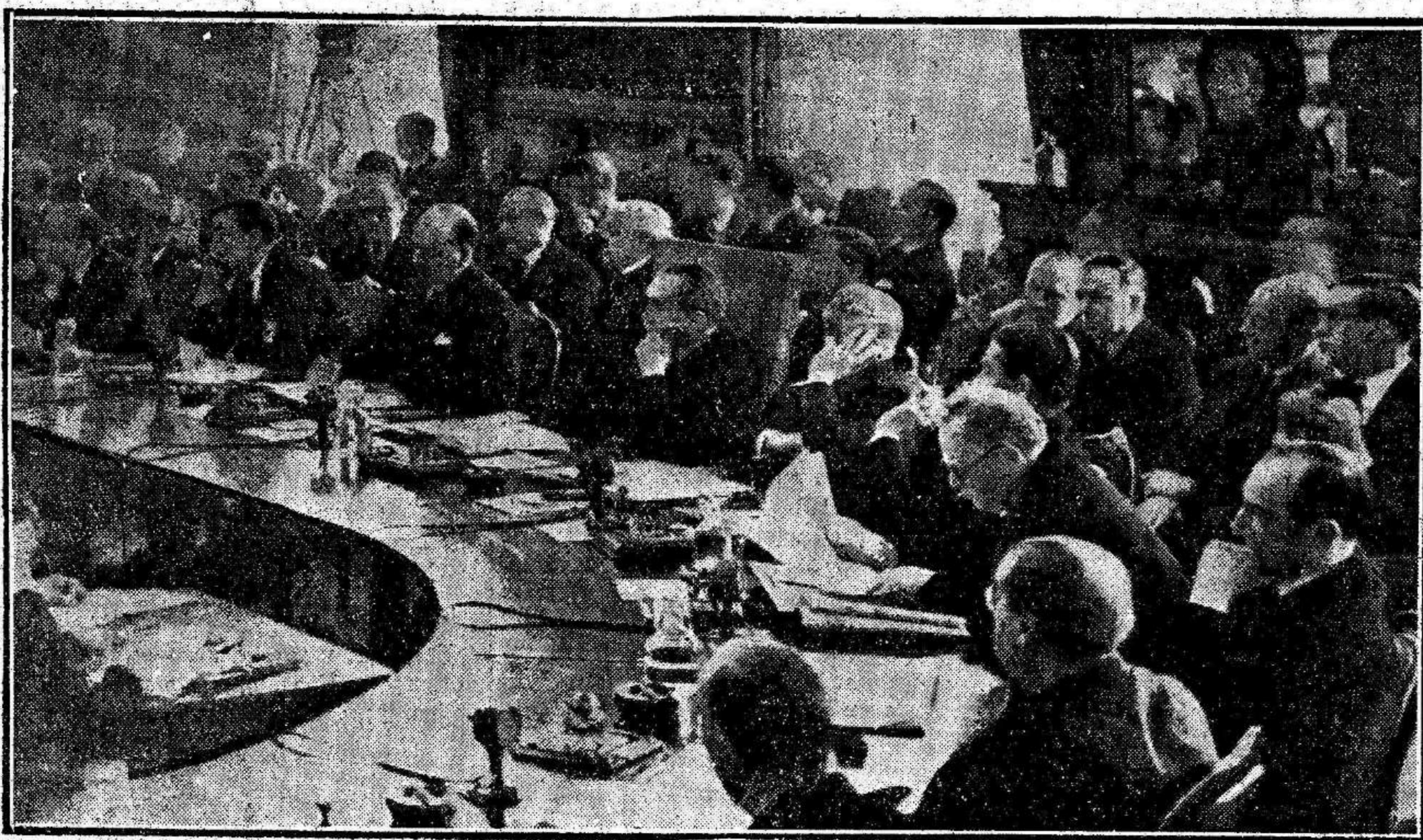
He aquí a la Sociedad de Naciones reunida en el palacio de Saint James. Preside esta reunión Mr. Bruce y asisten como delegados Flandin, Grandi, Avenol, Eden, Litvinoff y nuestro Salvador de Madariaga, indiscutible autoridad en estos altos menesteres diplomáticos.