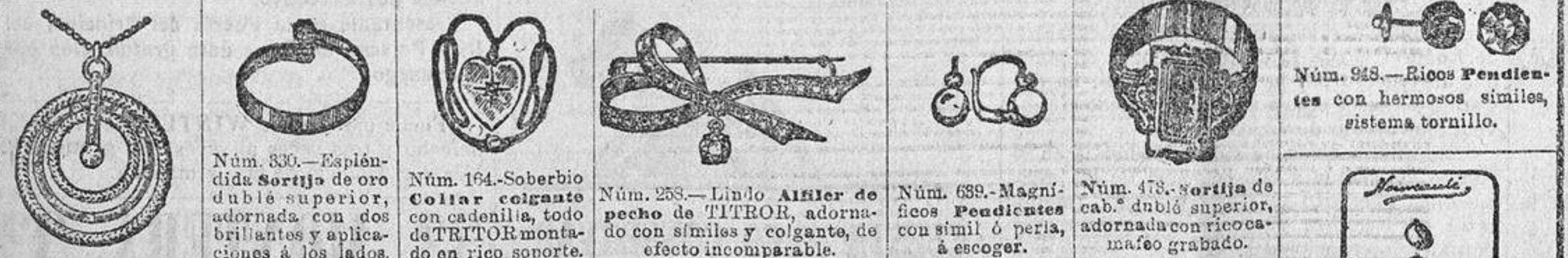
Núm. 529.—Magnífico Disco colgante formado de tres círculos modelos alta novedad, de dorado excelente. Núm. 530.—Espléndida Sortija de oro doble superior, adornada con dos brillantes y aplicaciones a los lados. Núm. 164.—Soberbio Collar colgante con cadencia, todo de TITROR montado en rico soporte. Núm. 258.—Lindo Anillo de pecho de TITROR, adornado con similes y colgante, de efecto incomparable. Núm. 639.—Magníficos Pendientes con similes y perlas, a escoger. Núm. 478.—Sortija de cab.º doble superior, adornada con ricasca-mafio grabado.