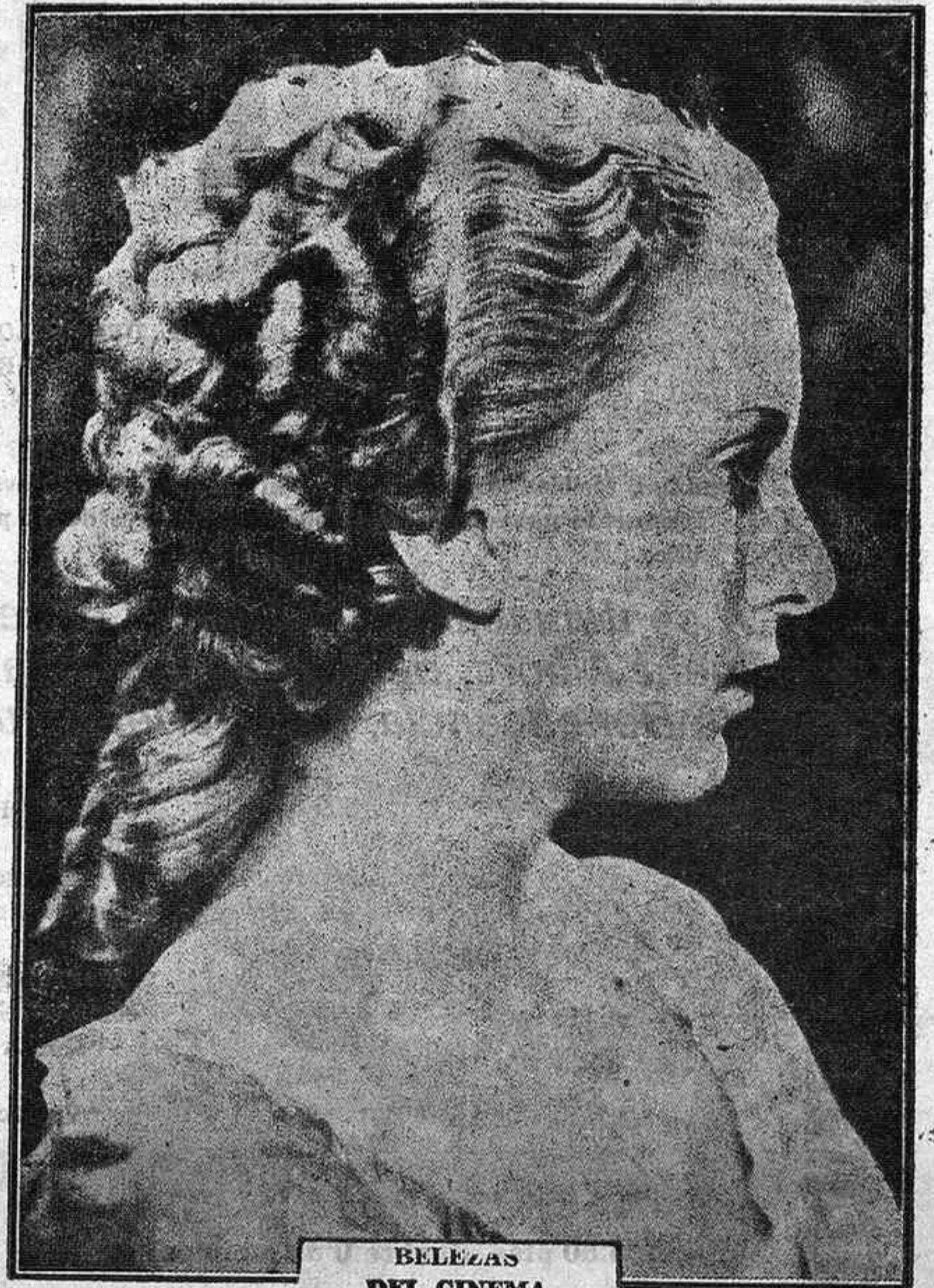
BELEZAS DEL CINEMA

Y la defensa de la casa productora, como principal argumento expone que los herederos restituyan las 200.000 pesetas que se embolsaron como derechos de compra de la escenificación de "Naná" y que le fueron abonados para concertar el acuerdo. Pero ahora resultará que a los herederos también complicados en el estruendo de Prensa, no les restan fondos y todo contribuirá a que el asunto, tome una nueva derivación.