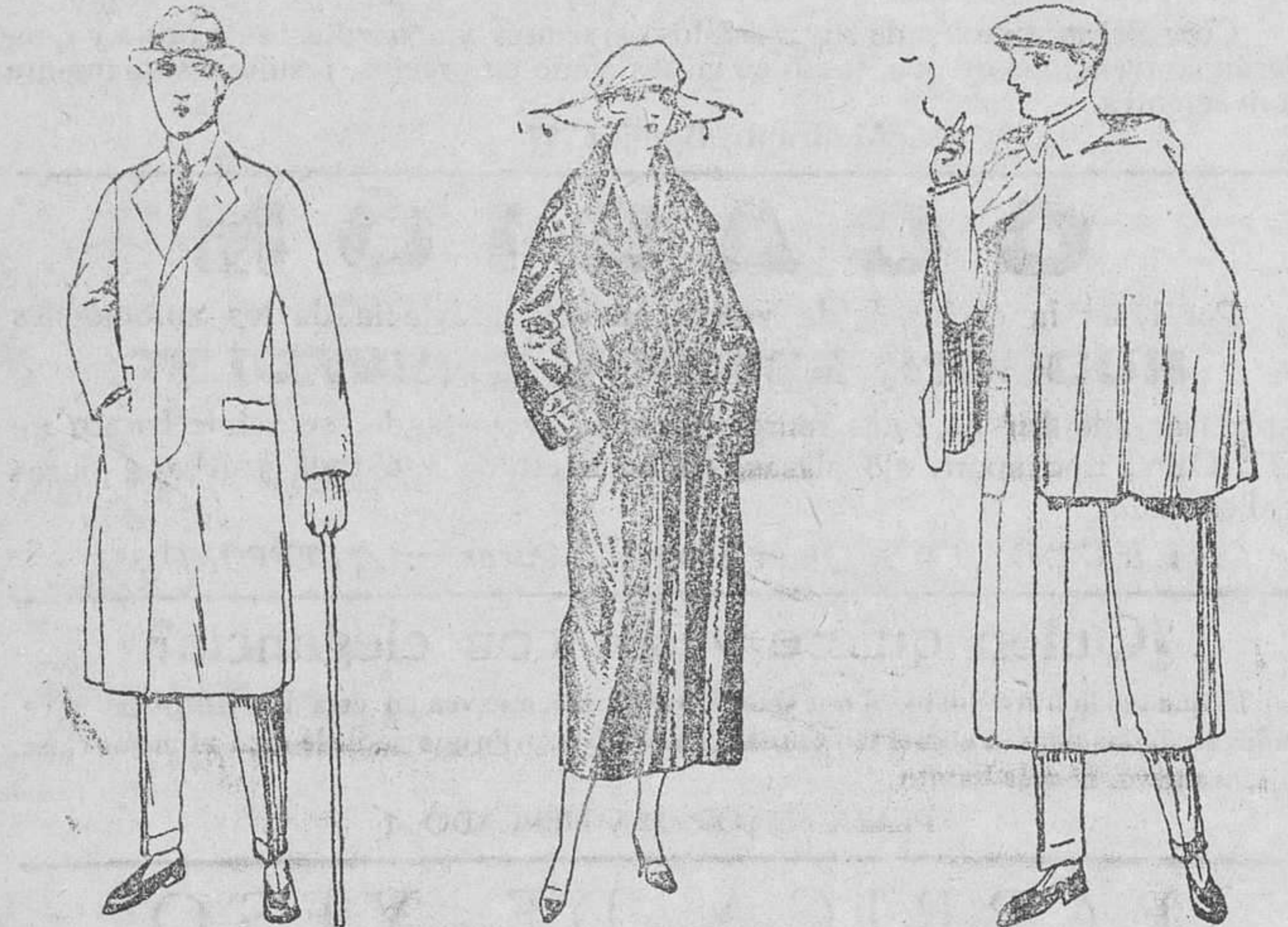
Gabardinas de lana, desde 90 á 160 pesetas. Gabardinas novedad, á 90, 100, 115, 125 pts. Impermeables seda de 100 á 160 pts. Impermeables á 110, 115 y 125 pesetas. Precio fijo verdad. Todos los artículos marcados.