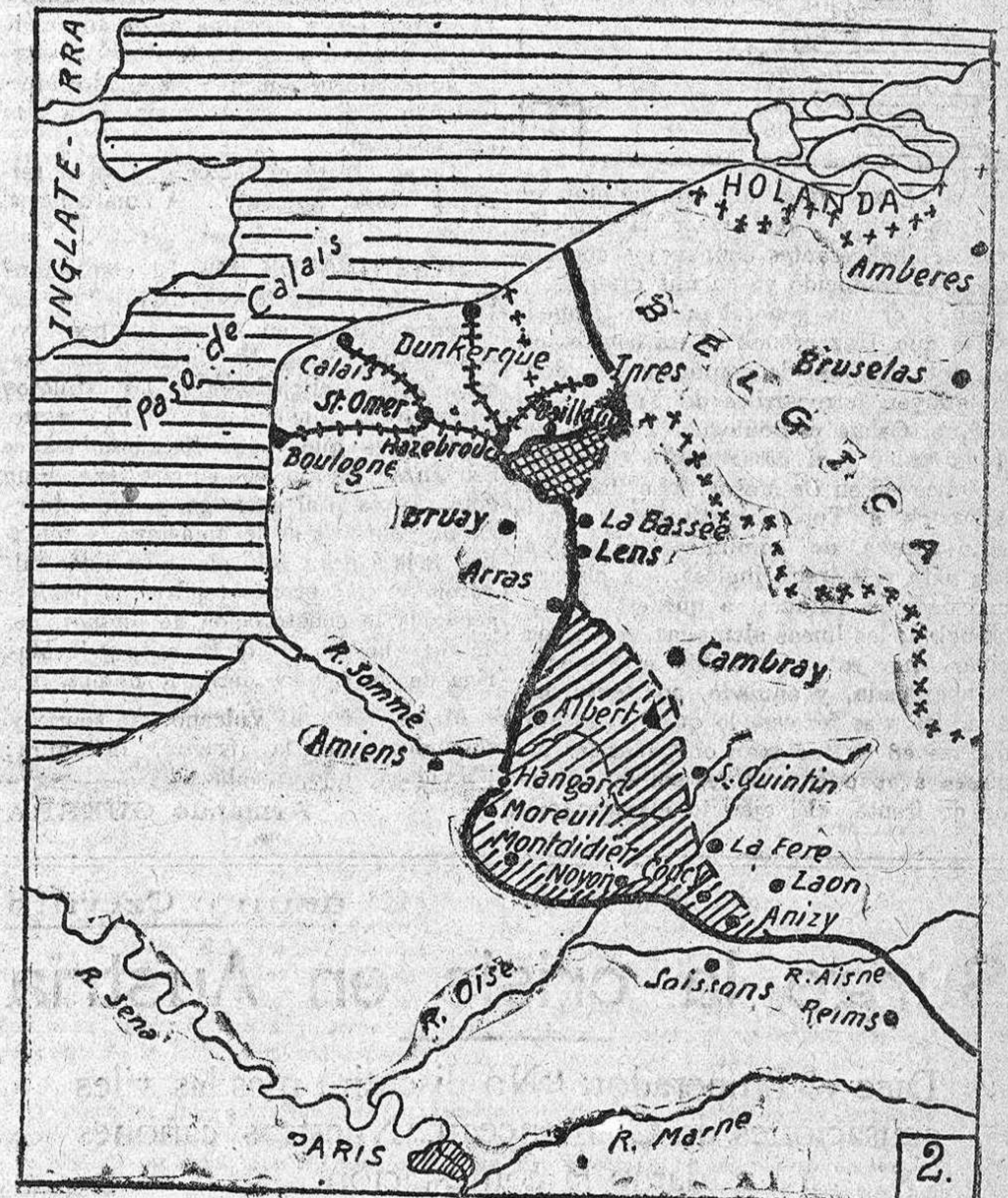
Escala 0. 20. 40. 60. 80. 100. Posición que ocupaban los alemanes el 21 de Marzo id. aproximada actual. Zona conquistada desde el 21 Marzo al 7 Abril. Id. id. desde el 9 al 14 Abril. ambas inclusive.