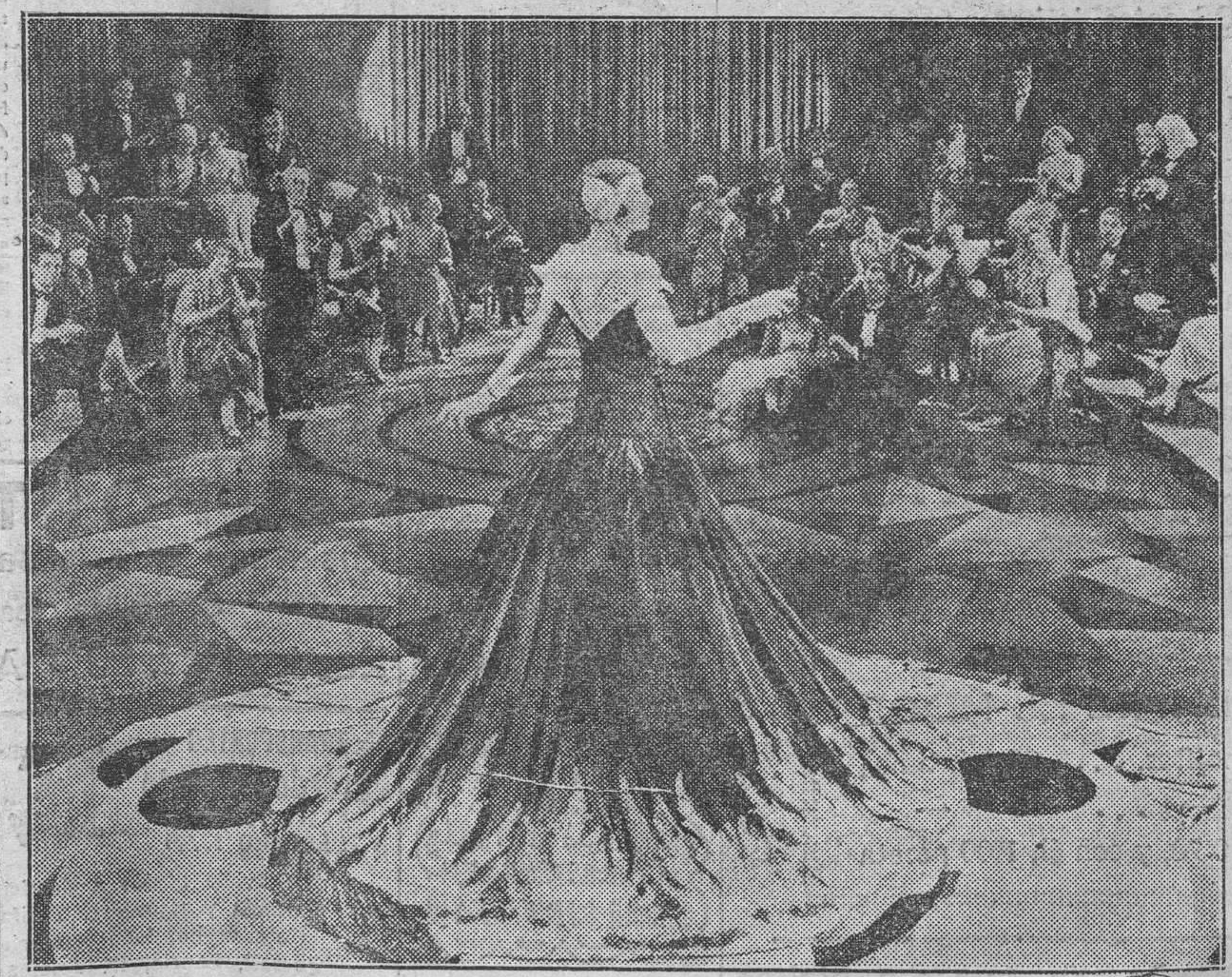
Una escena de esta extraordinaria película de gran presentación, verdadero derroche de arte de la protagonista Mme. Wallace Reid.