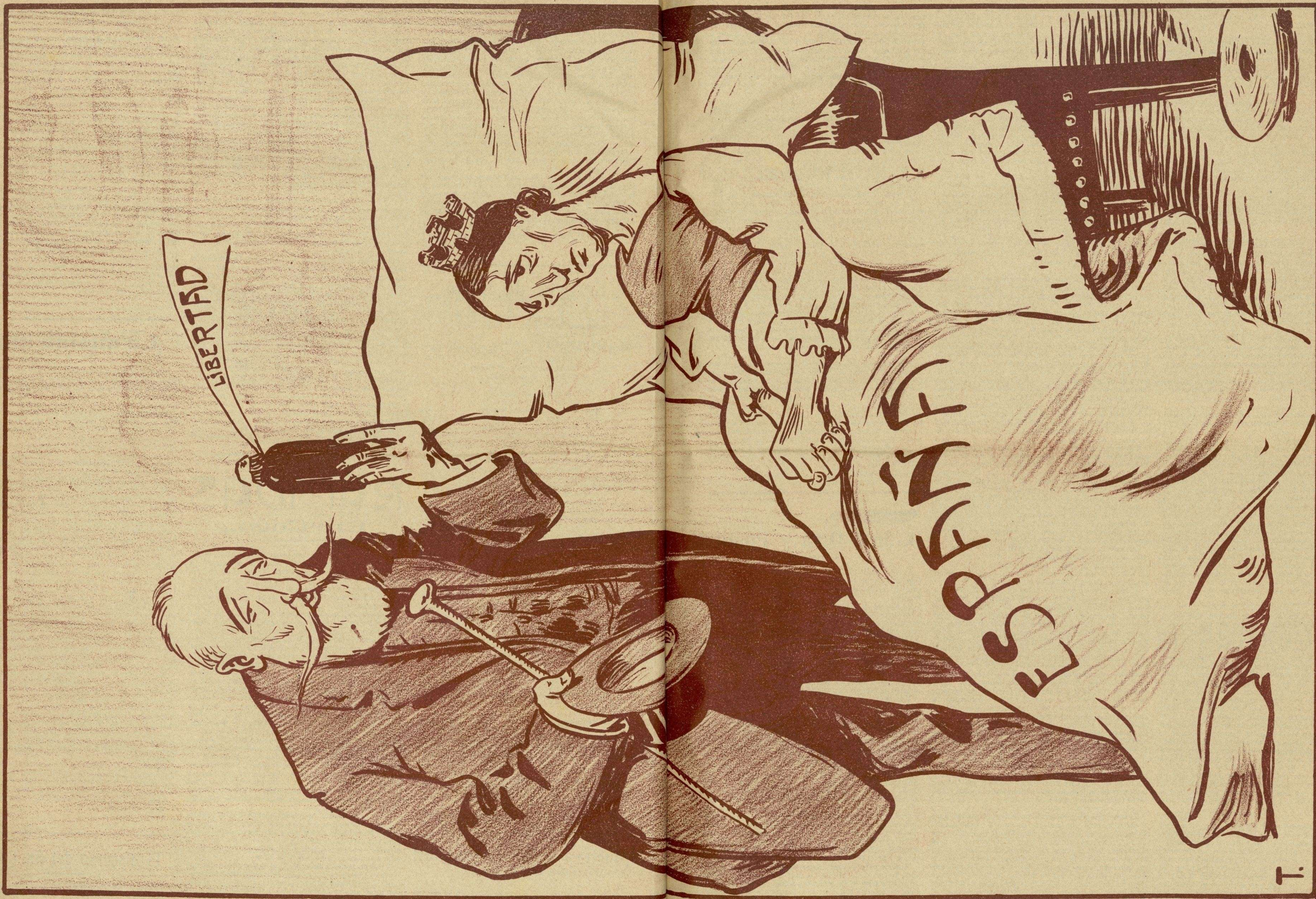
REMEDIOS DE CURANDERO

MORET. — Señora, los excesos de la libertad, con la libertad se curan.