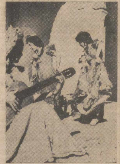
Grupo de Granada que actuará en el Festival "Coros y Danzas de España".

Dentro de pocas horas Palencia dará comienzo a sus fiestas, con motivo de sus Ferias grandes de San Antón, y durante una semana —semana grande— tendremos ocasión de divertirnos y pasar unas horas felices y alegres, acudiendo a todos los festejos populares organizados por nuestro Ayuntamiento; a las dos soberbios espectáculos taurinos, y a las extraordinarias funciones que se anuncian en los