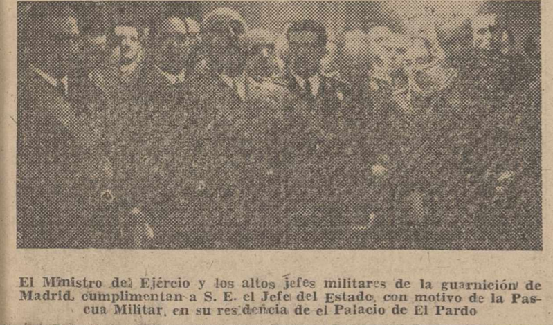
El Ministro del Ejército y los altos jefes militares de la guarnición de Madrid...

Cunde el pesimismo entre los exilados "rojos" españoles