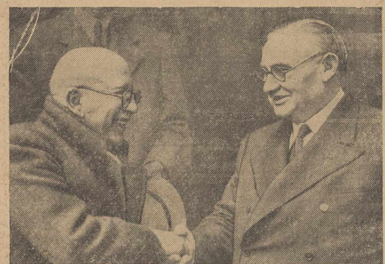
El Primer Ministro egipcio, Sidky Pacha, durante su reciente estancia en Londres, mantuvo interesantes conversaciones con Mr. Bevin y Mr. Attlee. En la fotografía, el Ministro egipcio es saludado por el secretario del Forcing Office, a su llegada a la capital inglesa.