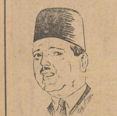
MAHUD FAHMY NOKRASHY

Jefe del partido Wafdista y del Gobierno egipcio. Ha sido Ministro varias veces y perteneció al Partido Wafdista, que abandonó en 1933, al ser designado jefe de los saadistas. En el actual Gobierno egipcio, desempeña la presidencia y los Ministerios de Asuntos Exteriores y del Interior. Por primera vez, fue ministro en 1945.