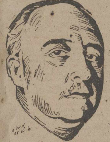
S. E. EL JEFE DEL ESTADO

ESTUDIARA PERSONALMENTE LOS PROBLEMAS DE DICHA REGION