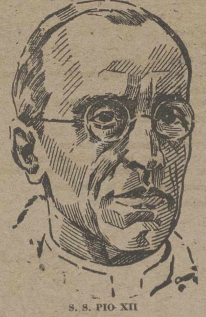
S. S. PIO XII