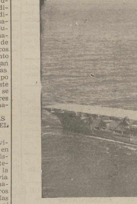
LA MARINA BRITANICA. — El porta-aviones "Ark Royal"

Ha recorrido con sus aviones unos cinco millores de millas cuadradas marítimas