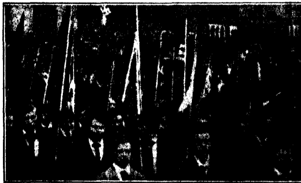
Els «pomells de joventut» hitlerians desfilarant per la Porta Brandenburg (Berlín)