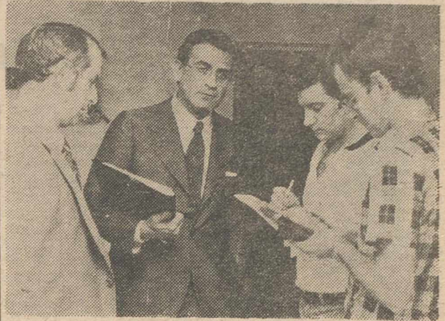
MADRID.— El ministro de Transportes y Comunicaciones, Salvador Sánchez Terán, dialoga con los periodistas, después de la reunión mantenida con otros ministros implicados en el conflicto pesquero.— (FOTO CIFRA GRAFICA).