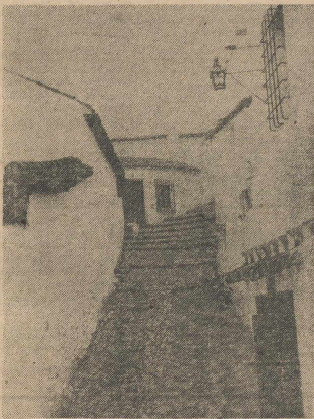
TOMAR CONCIENCIA DEL ASUNTO

El abandono de los pueblos —muchas veces masivo—, motivado en la mayoría de las veces por las precarias condiciones de vida, la avalancha turística, que ha visto en los pueblos pequeños un filón y, en definitiva, la transformación económica y social, centrado en un absurdo afán de modernizarlo todo a base de derribar, ha puesto en peligro el patrimonio arquitectónico rural, ha desfigurado el paisaje y lleva camino de ir hacia un habitat cada día más inhumano.