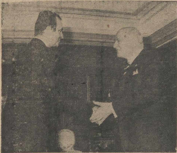
MADRID. — El Rey Don Juan Carlos durante la audiencia mantenida con el presidente de la Generalitat de Cataluña, Josep Tarradellas, en el Palacio de la Zarzuela.