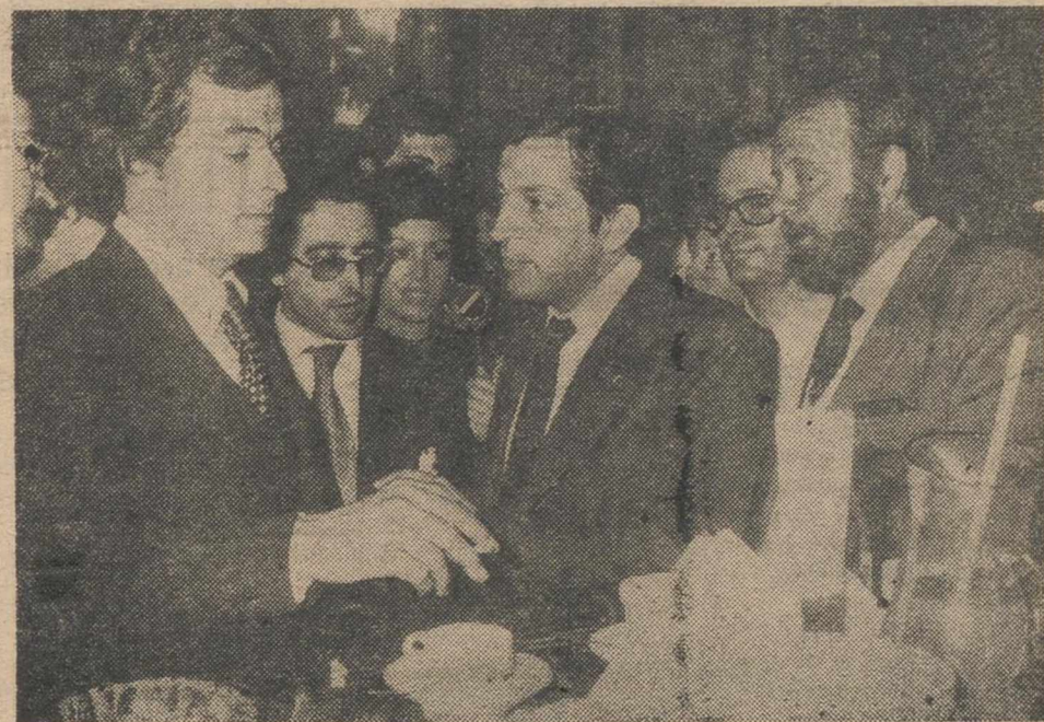
MADRID. — El presidente del Gobierno, don Adolfo Suárez, charlando mientras toma un refrigerio en el bar de las Cortes, tras su intervención en el Pleno del Congreso. — (Foto EUROPA PRESS).

Señaló después que es más fácil subrayar los fallos que valorar lo conseguido e invitó a la derecha-derecha y a la izquierda-izquierda a releer sus previsiones y ver