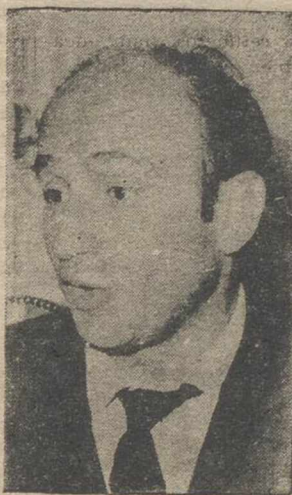
MADRID, 24. (Efe).—Adolfo Marsillach ha sido nombrado director del Centro Dramático Nacional por el ministro de Cultura.

El centro funcionará a través de dos salas y un centro-estudio. Una de las salas se dedicará al repertorio del teatro universal y la otra al estreno de autores españoles.