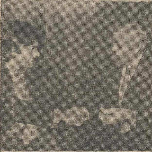
MADRID. — Un momento de la entrevista mantenida en la sede del PSOE entre Felipe González y el ex-primer ministro laborista británico, sir Harold Wilson.

El político inglés se mostró partidario del ingreso de España en la CEE