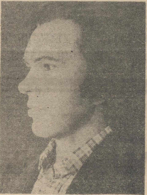
Entre don Adolfo Suárez, presidente del Gobierno español, y SS. MM. los Reyes de España, ha quedado inmortalizado el secretario general del Partido Socialista Obrero Español Felipe González, en una de las mejores realizaciones escultóricas que ha hecho el Museo de Cera Colón.