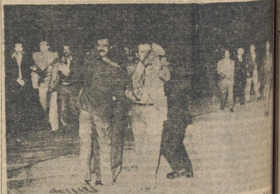
AEROPUERTO DE LARNACA (Chipre). — Comandos egipcios apoyados por miembros de la Guardia Nacional chipriota rescataron a los 16 rehenes que dos terroristas mantenían secuestrados en un avión de las líneas aéreas de Chipre, después de haber asesinado al

La familia Franco recorrió la zona afectada por el incendio y permaneció durante varias horas en el Pazo.