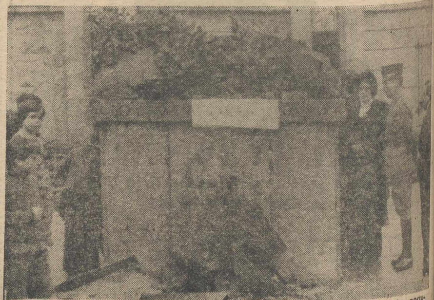
LISBOA. — Curiosos ante los restos de la estatua de bronce del dictador portugués, Antonio Oliveira Salazar, el cual ha sido destruido por la explosión de un artefacto explosivo. El atentado ha tenido lugar dos días después de que los habitantes de Santa Comba Dão, lugar en el que nació Salazar, se enfrentaran a la Policía cuando trataban de restaurar el monumento.