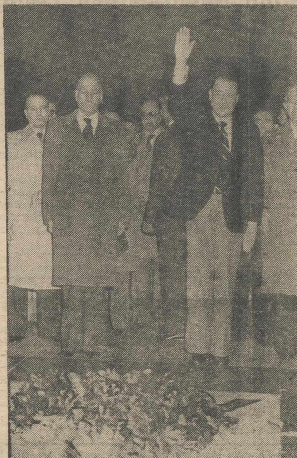
MADRID. — El secretario general del MIS, partido neo-fascista italiano, acompañado por el notario madrileño y líder de "Fuerza Nueva", Blas Piñar, durante la visita que ha efectuado al Valle de los Caídos en donde depositó sendas coronas de flores ante las tumbas de José Antonio y del General Franco. —.

MADRID, 17 (Efe). — El secretario general del Movimiento Social Italiano, Giorgio Almirante y el presidente de Fuerza Nueva, Blas Piñar, han hecho un comunicado conjunto en el que señalan la similitud de sus partidos frente a los mismos peligros y el mismo motivo de defender la libertad en Europa Occi-