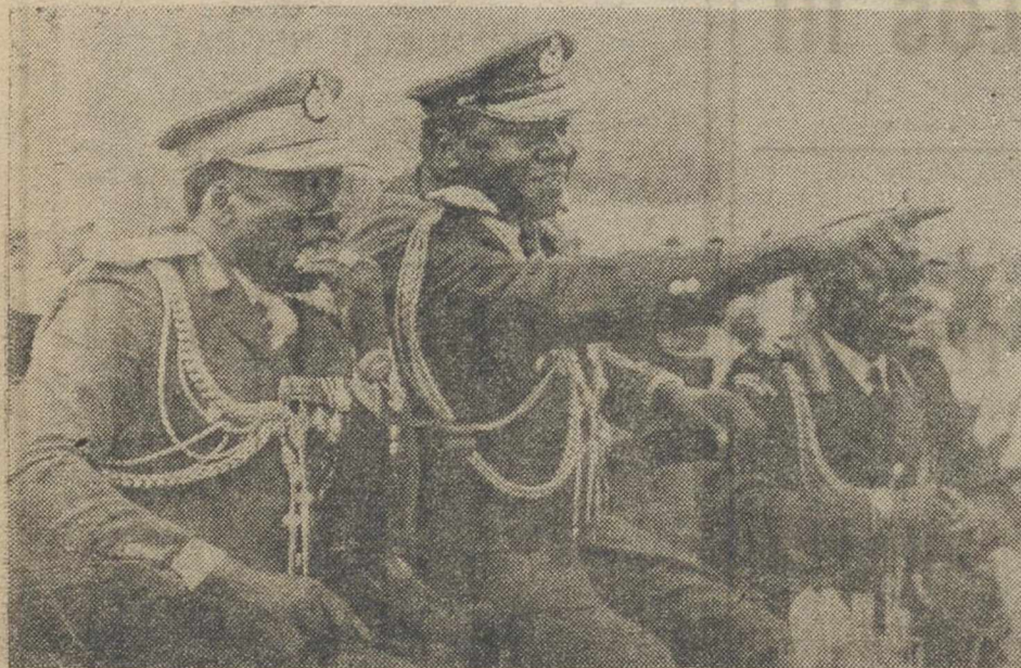
KOBOKO (Uganda). — El presidente de Uganda, Idi Amin, acompañado por el vicepresidente, Mustafa Adrisi, presiden las celebraciones del aniversario del golpe de Amin en Uganda.