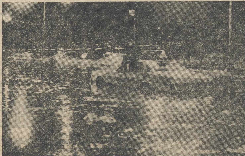
NUEVA YORK. — Un taxista de Nueva York espera a recibir ayuda sentado en el techo de su automóvil, el cual aparece rodeado por las aguas en una calle de la ciudad a causa del deshielo de la nevada caída recientemente.