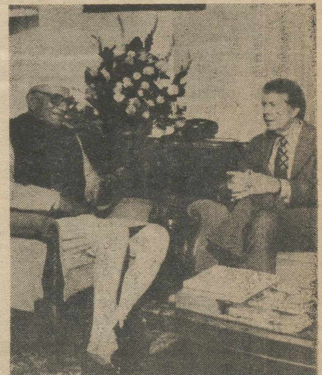
NEUEWA DELHI. — El presidente Jimmy Carter durante la entrevista que ha mantenido en Nueva Delhi con el primer ministro indio, Morarji Desai, en el Palacio Presidencial de Rashtrapati Bravan. — (Telefoto EUROPA PRESS).

BEIRUT 2 (Efe). — El presidente Jimmy Carter se ha mostrado dispuesto a reconocer los derechos nacionales del pueblo palestino y a aceptar las posiciones árabes, indica la agencia saudita de información.