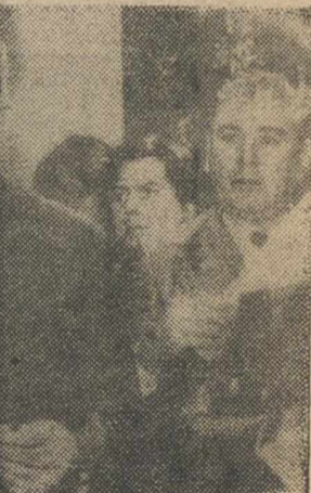
Presidente chileno, Eduardo Frei, en un momento del discurso nacional para determinar el futuro del país, con el general Pinochet por tachado de parcial.