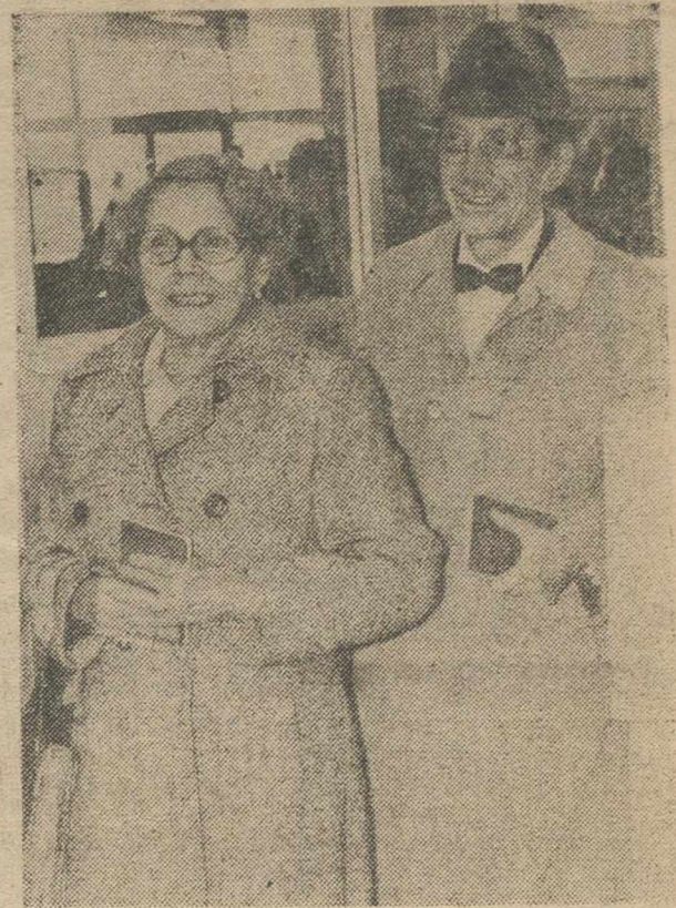
MADRID. — Don José Ignacio Barraquer, famoso oftalmólogo español, secuestrado hace quince días en Bogotá y liberado hace unos días, llegó al aeropuerto de Madrid-Barajas. El doctor Barraquer había expresado su intención de venir a España para pasar la Nochevieja con sus familiares como todos los años. En la foto, el doctor Barraquer y su esposa, después de pasar el control de pasaportes.

MADRID, 2 (Cifra). — La Comisión de Urgencia Legislativa ha aprobado, por unanimidad, los dos Reales Decretos-Ley referidos a régimen preautonómico para el País Vasco y procedimiento para adoptar las decisiones en Navarra.