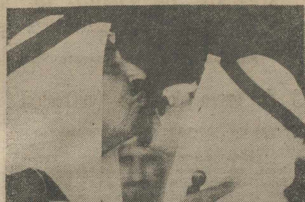
KUWAIT sme jeque de Sa de dic