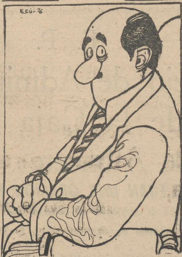
La cosa está clara. Lo que los huelguistas querían, era tomar al Gobierno la medida con el "Metro"...