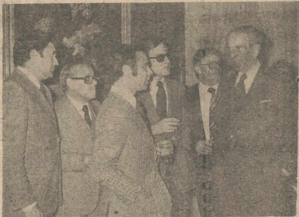
MADRID.—Don Antonio Garrigues y Díaz Canabate, ministro de Justicia, dialogando con los periodistas, que habitualmente realizan información sobre dicho Departamento. El ministro se encontraba acompañado de altos cargos del Departamento.