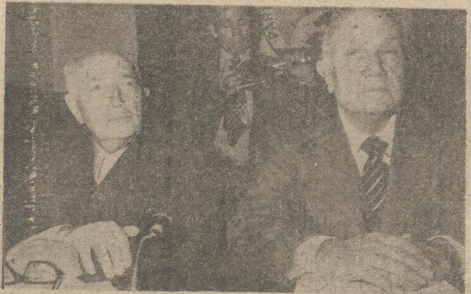
ROMA.—Pietro Nenni, líder socialista italiano y Francesco De Martino, secretario general de dicho partido, durante la apertura de los dos días de reuniones que según se decida en las mismas, podrían hacer caer el Gobierno de Aldo Moro.