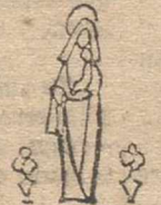
The virgin «zde viryín»