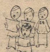
Choir boys «kuaiar bois»