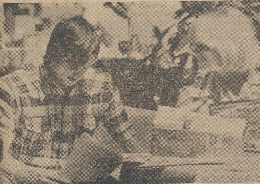
HILTRUP.—Johan Cruyff y su esposa en el hotel donde está concentrada la Selección Holandesa, clasificada para la ronda final del Mundial de Fútbol.