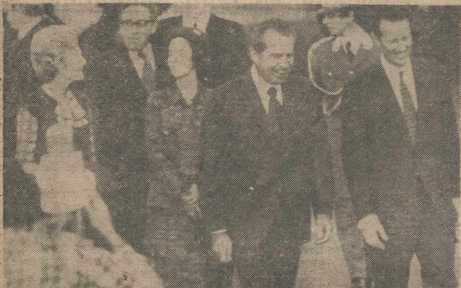
BRUSELAS.—La señora Pat Nixon, el secretario de Estado, Henry Kissinger; la reina Fabiola de Bélgica, el presidente Richard Nixon y el rey Balduino de Bélgica, poco después de que el presidente pasara revista a una guardia de honor que acudió a rendirle honores al aeropuerto.

El presidente de Estados Unidos informó sobre su viaje a Oriente y sobre sus próximas entrevistas en Moscú