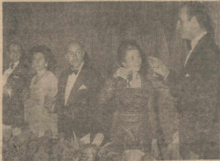
MADRID.—SS. AA. RR. los Príncipes de España, don Juan Carlos de Borbón y doña Sofía, han ofrecido, en el Palacio de "La Quinta", una cena de gala en honor de doña María Estela Martínez de Perón, vicepresidente de la República Argentina, con motivo de su visita oficial a nuestro país. Entre otras personalidades, asistieron los presidentes del Gobierno y de las Cortes, y los ministros de Trabajo y de Comercio.