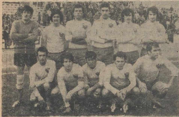
Sporting de La Gineta.