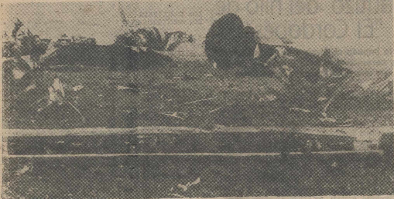
SANTA CRUZ DE TENERIFE.—Por causas que se desconocen, un avión "Convair 990", de la compañía aérea de vuelos "charters", Spantax, se estrelló contra el suelo, momentos después de despegar del aeropuerto de Los Rodeos, de Santa Cruz de Tenerife. Sus ciento cuarenta y ocho pasajeros, en su totalidad turistas alemanes, y los siete miembros de la tripulación de la aeronave, perdieron la vida. En la fotografía, restos diseminados del avión siniestrado.

SANTA CRUZ DE TENERIFE, 3.—Un avión de la compañía Spantax se ha estrellado a primera hora de esta mañana, nada más despegar del aeropuerto de Los Rodeos, de esta isla.