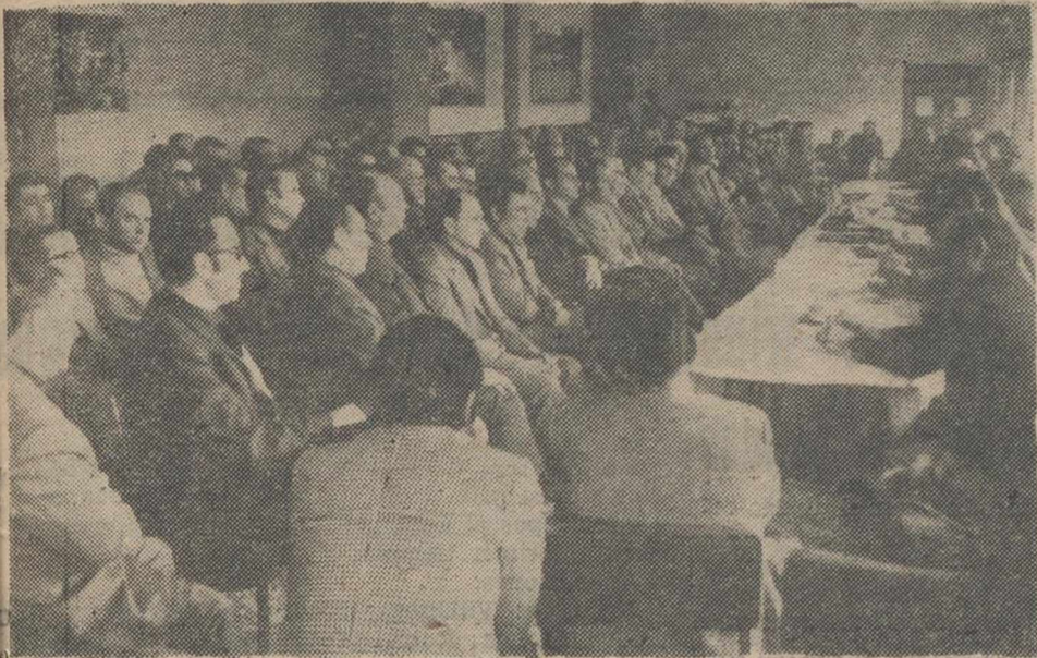
Un aspecto del acto de clausura de la Asamblea de Autoridades y Mandos, celebrado el domingo en las Lagunas de Ruidera.

viene de la PRIMERA Trabajo y P.P.O.; Sanidad, Vivienda y Turismo; Sindicatos, C.O.S.A. y Cooperativismo; Diputación Provincial; Juventudes, Sección Femenina y Guardia de Franco; Cultura, Familia, Educación Física y Deportes y Política Local (Proletariado y Patronato de la Vivienda Rural). Todas estas secciones fueron presididas por sus correspondientes delegados de servicio y asistidas por los jefes de los oportunos departamentos.