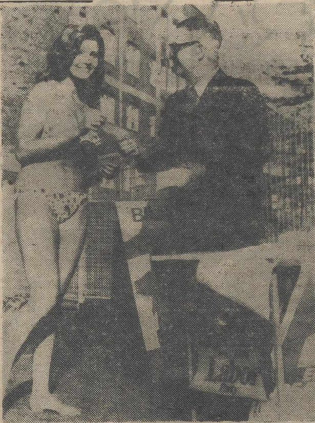
SIDNEY.—La joven australiana de la foto, no ha querido perder su día de playa por causa de las elecciones. Por eso, tan sólo ha dejado un momento la arena de la play para ir a cumplir su deber ciudadano de emitir su voto en el colegio cercano. La falta de equipo no es inconveniente para que se admita su papeleta. Más bien todo lo contrario, a juzgar por la expresión del presidente de la mesa.