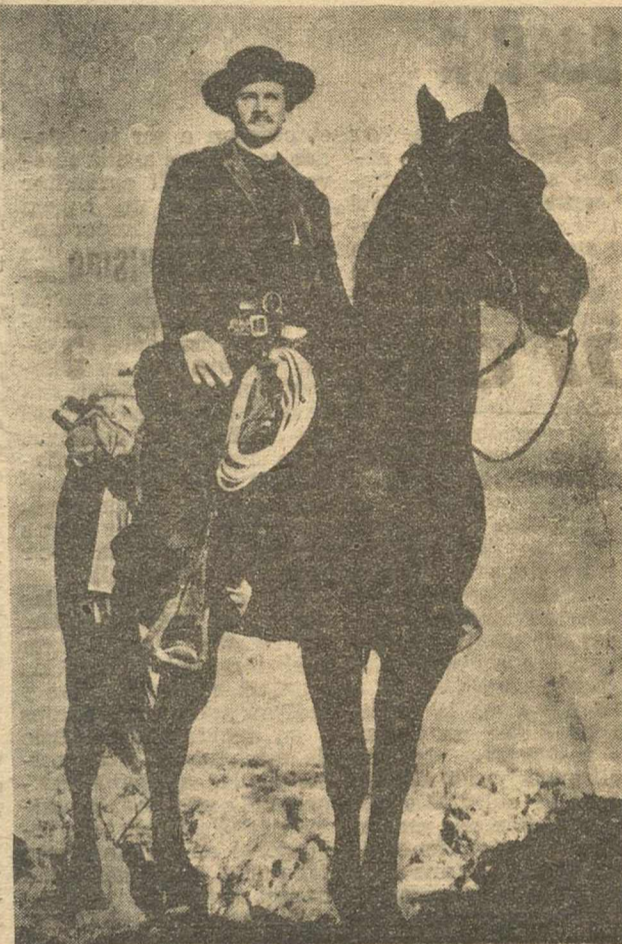
Montana, capitaneando a un grupo de facinerosos reclutados en las montañas, no tardó en descubrir la diligencia. Sin pérdida de tiempo, ordenó el ataque a sus secuaces.

Cuando se hubo enjuagado convenientemente, sin que el sheriff pudiera ni suponerlo, el malhechor se acercó a sus espaldas y le propinó con la culata del revólver un fuerte golpe en la cabeza. El sheriff se desplomó pesadamente al suelo, sin sentido.