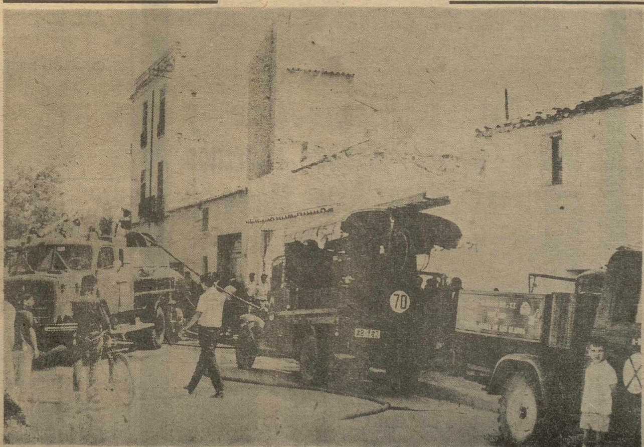
Ofrecemos a nuestros lectores una nota gráfica que se refiere al incendio de esta mañana en la calle del Carmen y que recoge un momento de los trabajos de extinción realizados conjuntamente por el Servicio Municipal de Bomberos y los servicios contra incendios de la Base Aérea de los Llanos. De este suceso damos información en última página.