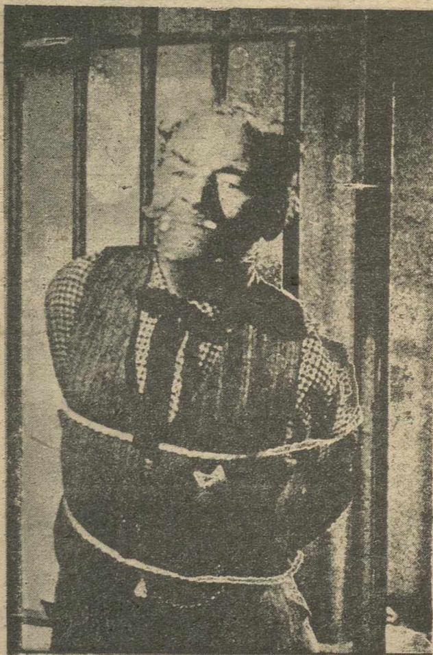
Zed Montana, que había sorprendido la conversación entre el sheriff y los Cartwright, ansioso por apoderarse de la diligencia, idea una estratagemma que engaña al representante de la ley. El bandido, antes de fugarse, ata y amordaza al sheriff, encerrándolo en la celda que él ocupara poco antes.