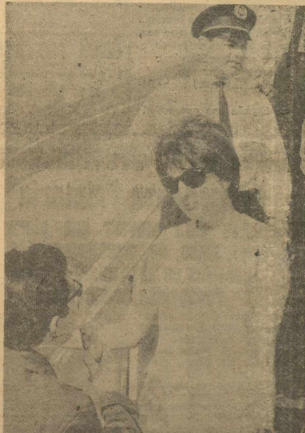
Procedente de Niza ha llegado a Madrid la ex-emperatriz de Persia, Soraya, quien poco después de su llegada al aeropuerto de Barajas, prosiguió viaje a Málaga. En la foto la vemos a su llegada al aeropuerto.