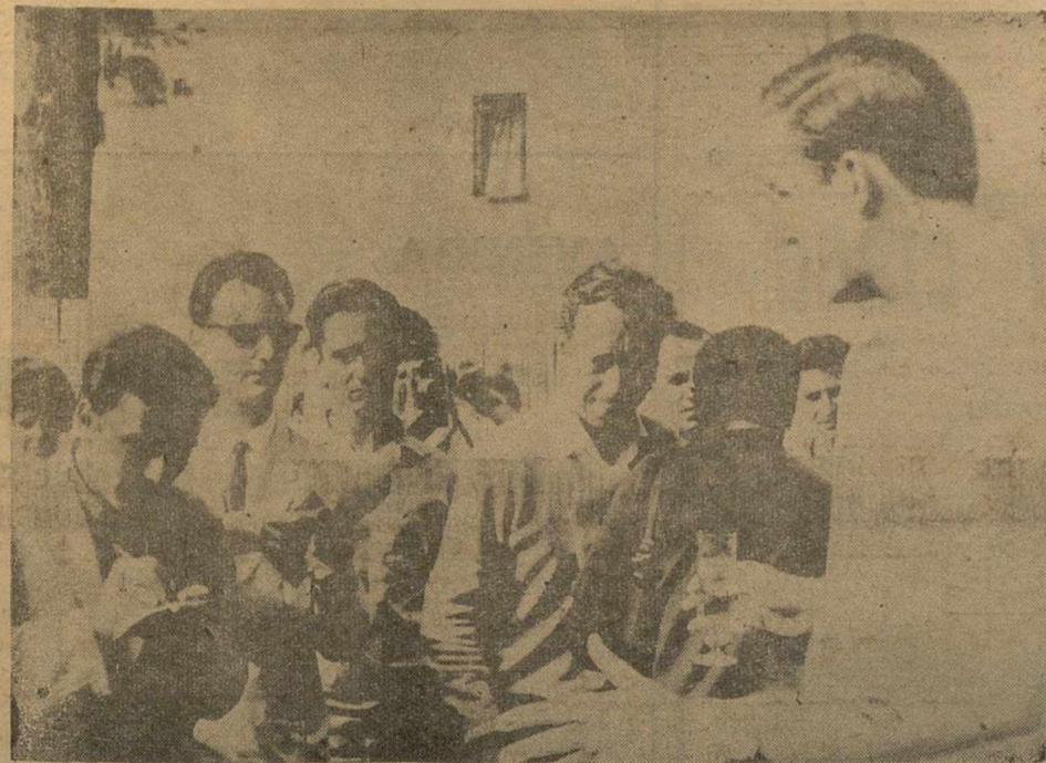
El propio rey Constantino dio la noticia del nacimiento de su hija a los periodistas congregados en el palacio de "Mon Rapés", los cuales felicitaron al monarca, correspondiendo éste con un brindis por la nueva heredera de los helenos.