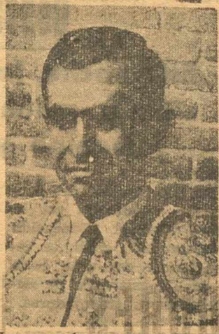
Las entradas cuestan caras y por ello al muchacho le

Bajo el título general que encabeza estas líneas el diario madrileño «Arriba» lleva a cabo una interesante encuesta, a la que contestan personalidades del mundo de los toros y en la que se formulan las cuatro siguientes preguntas: