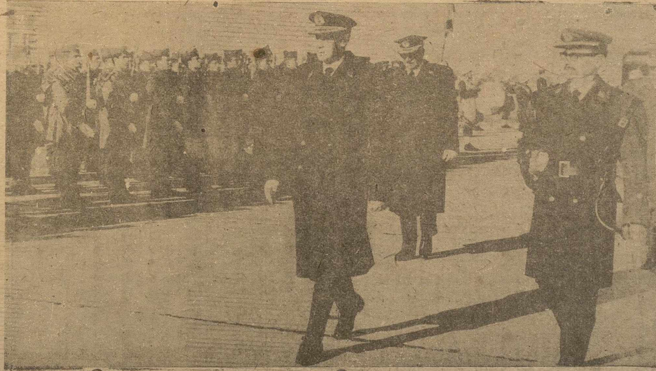
Los momentos de la estancia del ministro del Aire en la Base Aérea de los Llanos en la tarde de ayer—llegada al aeródromo y revista de las fuerzas que le rindieron honores—