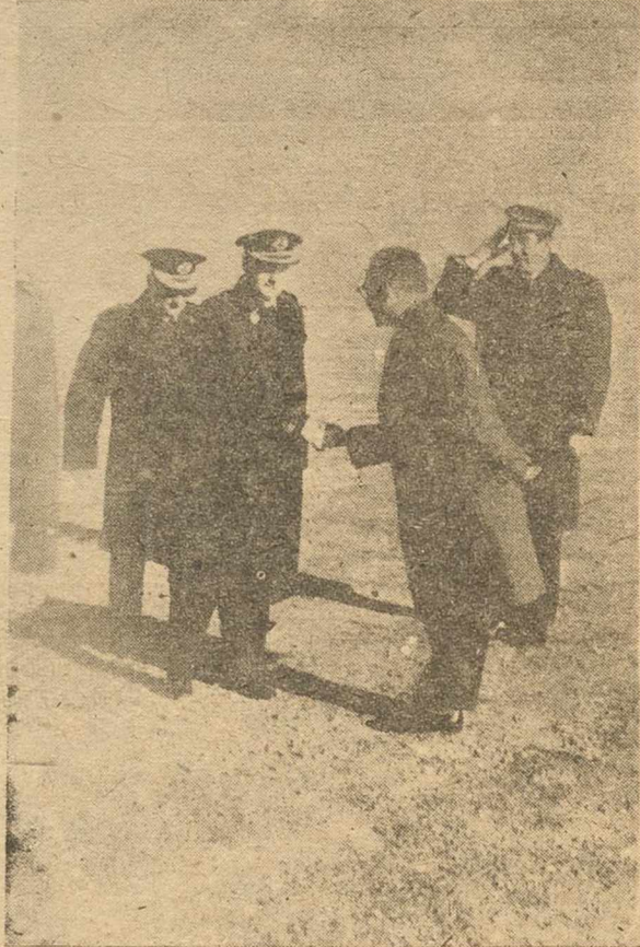
Nuestro director saludando al ministro del Aire cuando descendió del avión que le trajo a Albacete. Posteriormente, el teniente general Lacalle le hizo unas interesantes manifestaciones para LA VOZ DE ALBACETE, que reproducimos a continuación.