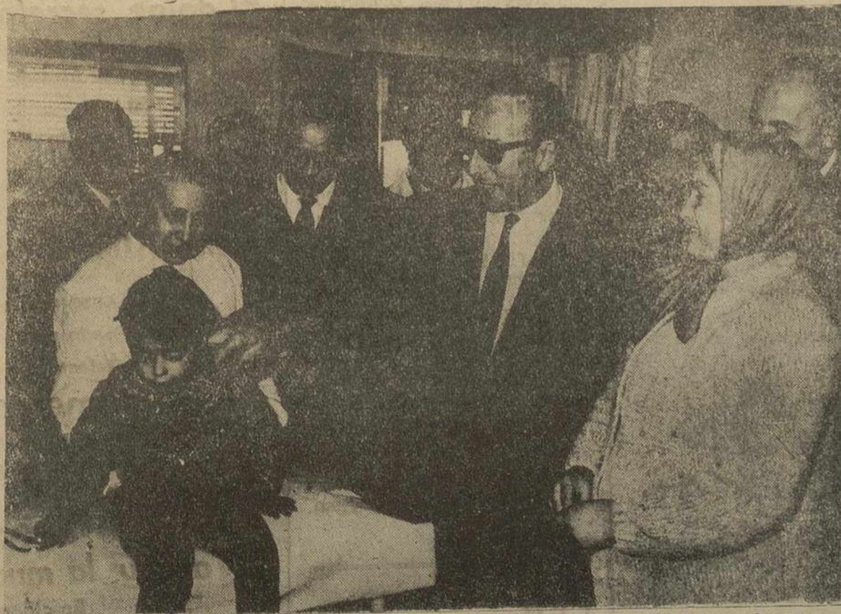
El ministro de Trabajo, señor Romeo Gorria, acaricia a un pequeño asegurado de la nueva unidad asistencial inaugurada en la Barriada de San Blas, de Madrid. En esta ocasión han sido inaugurados simultáneamente en España catorce nuevos ambulatorios del Seguro de Enfermedad.