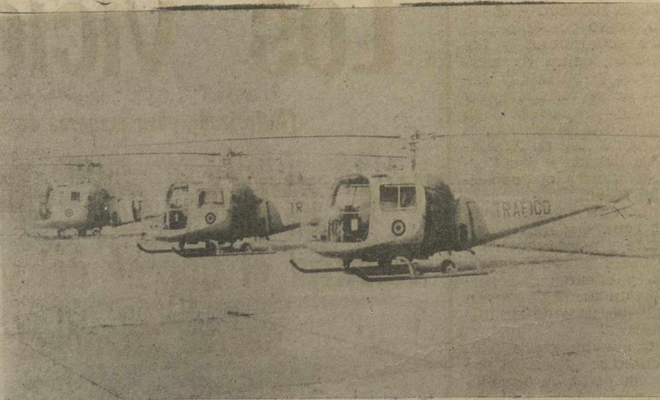
Los tres nuevos helicópteros Augusta Bell adquiridos por la Jefatura Central de Tráfico esperan su destino en el aeropuerto de Cuatro Vientos, Madrid. Dos, acondicionados como ambulancias aéreas, serán destinados a Madrid y Barcelona, respectivamente, y el otro está equipado y destinado para el traslado de altas personalidades.