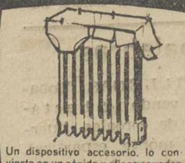
Un dispositivo accesorio, lo convierte en un rápido y eficaz secador.