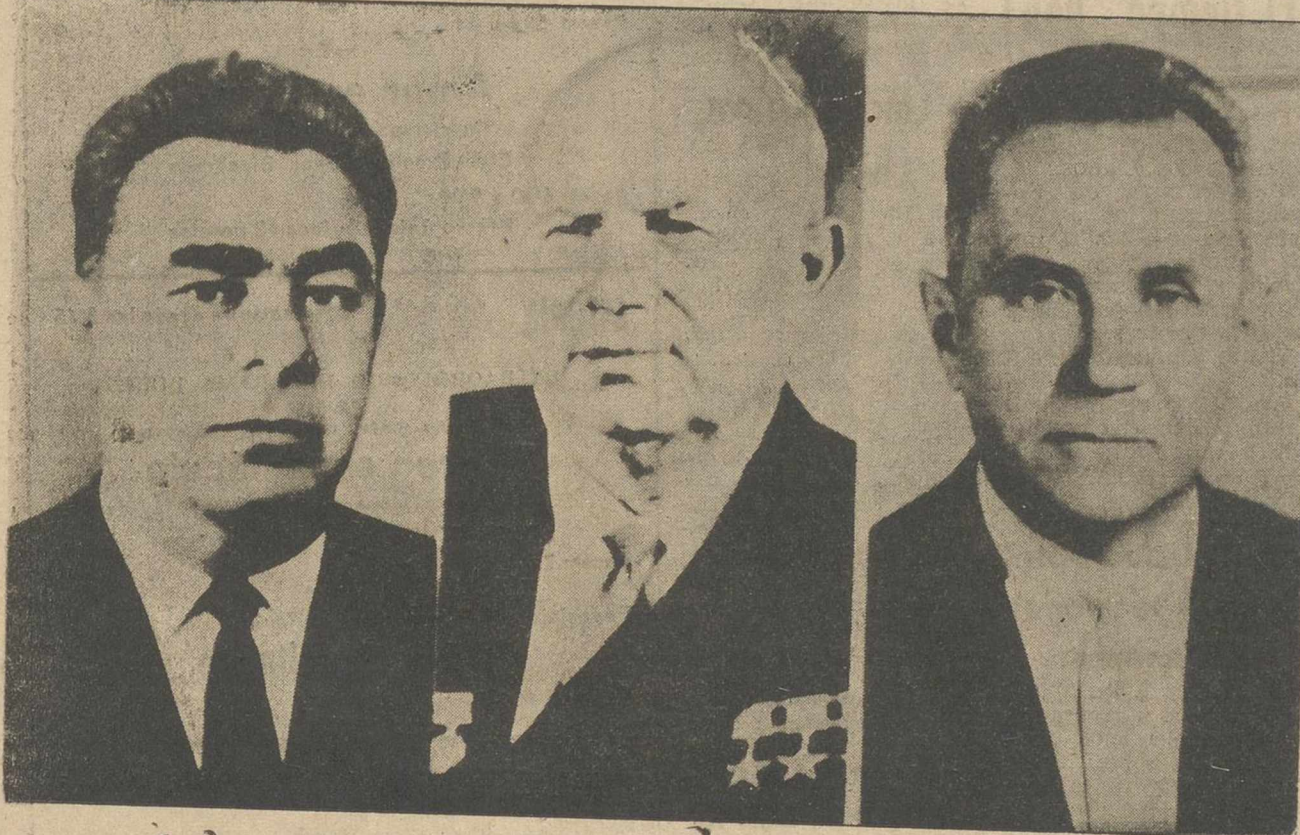
MOSCU.—Nikita Kruschef, que aparece en el centro de esta fotografía, ha sido destituido de sus cargos y sustituido, como jefe del Gobierno, por el hasta ahora vicepresidente del Gobierno, Alexei N. Kosygin, a la derecha de la foto, y como primer secretario del partido comunista de la URSS, por Leonid I. Brezhnev—a la izquierda—, hasta hoy primer vicesecretario del mismo.

MOSCU, 15.—El Comité central del partido comunista de la URSS, reunido el miércoles en sesión plenaria, estimó una solicitud de Kruschef para ser relevado de sus deberes "en vista de su avanzada edad y de su delicado estado de salud", según ha notificado la agencia soviética Tass en un despacho fechado hoy en Moscú.—Ete.