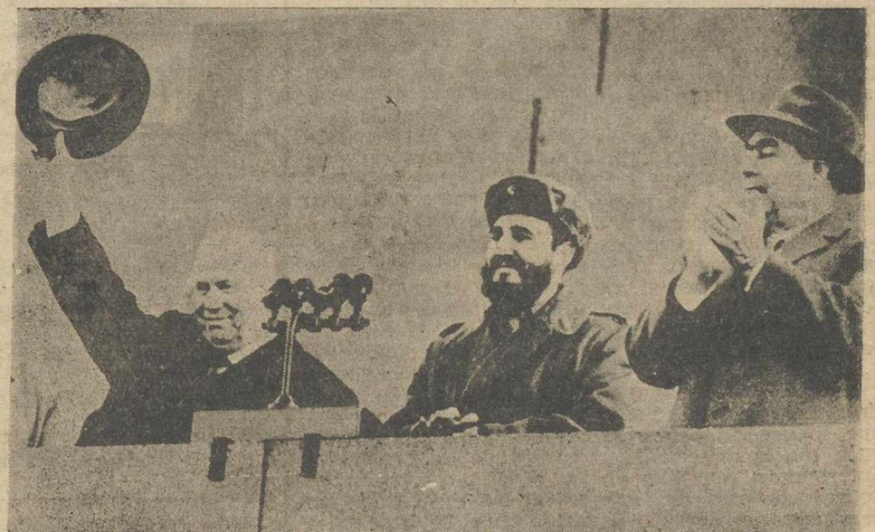
Aquí vemos a Nikita Kruschef, presidiendo un desfile en la Plaza Roja de Moscú, en compañía de Fidel Castro, durante la última visita a Rusia del jefe del Gobierno cubano. Ahora, en estos momentos, se encuentra en Moscú el presidente de Cuba, Dórticos, que ha sido recibido hoy por los nuevos dirigentes del Kremlin.

Krushchef ha sido difundida por la BBC. El propio Ha-