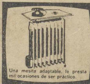
Una mesita adaptable, le presta mil ocasiones de ser práctico.

Cargado con WASSER-OL el medio de más elevado coeficiente de transmisión: fabricado en acero estampado con máxima superficie de radiación. Un mueble decorativo con 7,9 y 12 elementos. Su instalación no precisa obra alguna. Basta enchufarlo. No enrarece ni deseca el ambiente. No ofrece peligro de quemadura ni incendios. Montado sobre ruedas, es transportable a cualquier lugar. El único radiador que permite acercarse al calor.