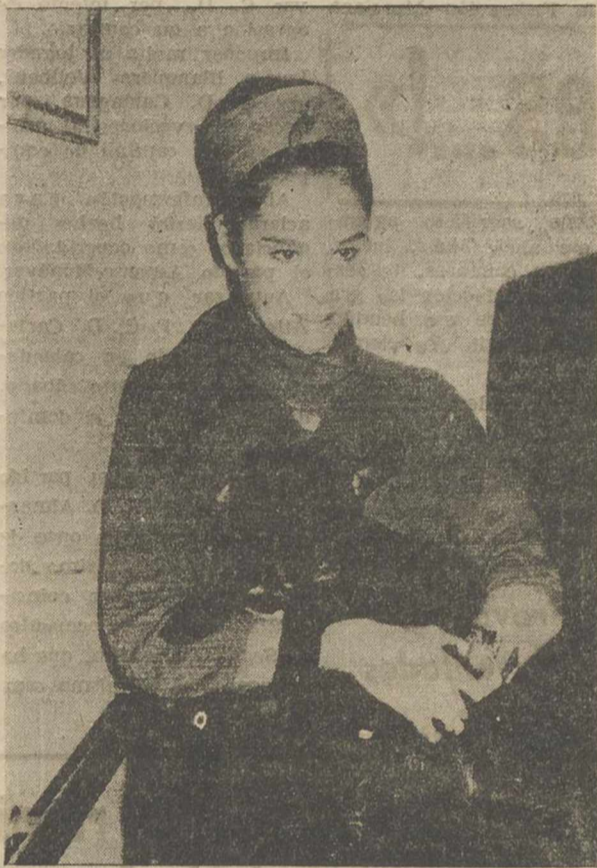
Ha llegado a Madrid la bailarina y actriz cinematográfica Geraldine Chaplin, hija del famoso cómico Charles Chaplin, la cual viene a España para participar en el rodaje de la película titulada "Una bella noche de verano". En la foto la vemos, acompañada de su inseparable perrito.