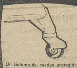
Un sistema de ruedas protegidas, lo sitúan donde el calor es preciso.