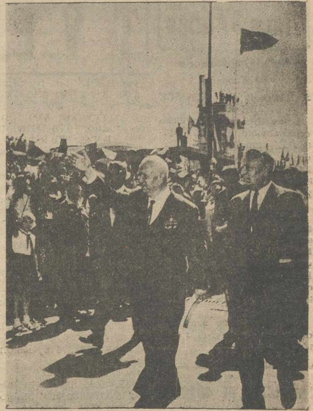
Esta es una de las últimas fotografías de Kruschef, el destituido jefe del Gobierno soviético, obtenida en el aeropuerto de Praga, durante su reciente visita a Checoslovaquia, con motivo del XX aniversario del alzamiento de Eslovaquia contra la ocupación alemana. Vemos a Kruschef, acompañado por el "hombre fuerte" de Checoslovaquia, el presidente de aquella República socialista, Antonín Novotný.

El mundo entero está sorprendido por la caída del primer ministro de la U.R.S.S. y se esperan grandes repercusiones en la política internacional