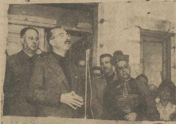
El Excmo. señor gobernador civil, dirigiendo la palabra al vecindario de Nerpio, con motivo de la inauguración de un magnífico grupo escolar, el pasado domingo.

El gobernador civil y jefe provincial del Movimiento, don Miguel Cruz Hernández, realizó el pasado domingo su primer viaje oficial a la provincia, desplazándose al pueblo de Nerpio, que es el más alejado de la capital, precisamente porque, como el mismo dijo en sus palabras al vecindario, son estos pueblos los que más necesitan de la atención y el aliento de las autoridades, para su incorporación a la vida nacional.