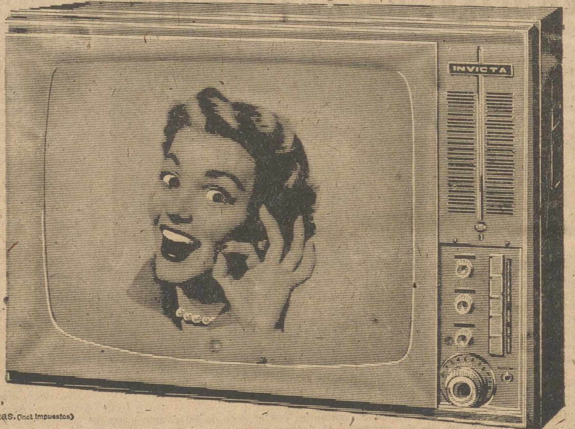
Modelo 1017-23" P.V.P. 22.500 ptas. (incl. impuestos)