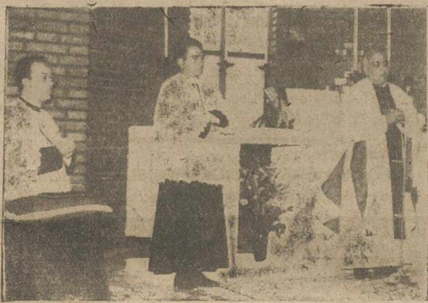
El Excmo. y Rvdmo. señor obispo de la Diócesis, durante la homilía que pronunció en la Misa oficiada después de la bendición del nuevo Altar Mayor de la Iglesia restaurada de Nerpio.

El obispo de la Diócesis bendijo el nuevo altar de la iglesia parroquial restaurada y un magnífico grupo escolar con viviendas para los maestros